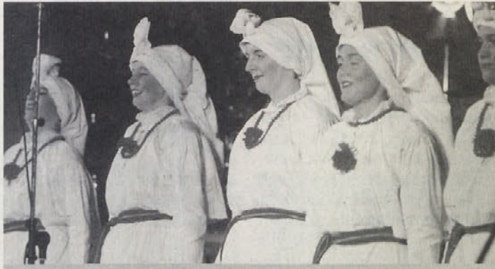
ŽITRAJSKI »OPEN AIR 98«