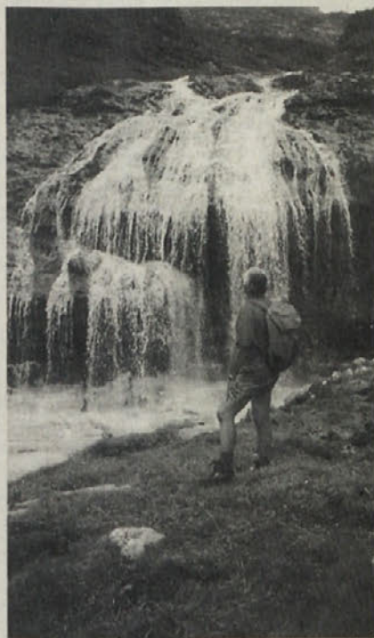
Potok Torbach preide v čudovit slap

Gorski svet ob teh jezerih pod strmimi mogočnimi stenami naju je tako navdušil, da sva še dolgo uživala njegovo prelestno lepoto. Šele ko so naju zagrnili oblaki, sva se hitro odpravila v dolino in imela srečo, da naju je dež ujel šele pri avtomobilu. L. U.