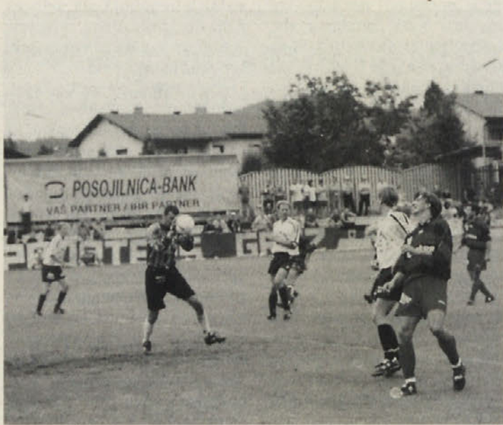
Akcije so potekale predvsem pred vrati SAK