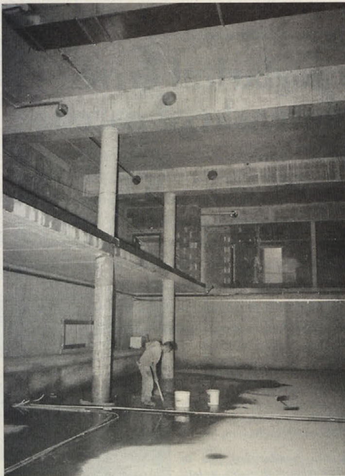
ŠPORTNA DVORANA V PLIBERKU

Ali je športna dvorana v Kulturnem domu Pliberk res prenizka in s tem neporabna in ali je res bilo deset milijonov šilingov nesmiselno investiranih? S to trditvijo je prejšnji teden nemški koroški tednik »Kärntner Woche« krepko razburil javnost, obenem pa je nehote odprl vprašanje, koliko so pismeni pristanki in potrdila pristojnih športnih organizacij sploh vredni? Kajti graditelj doma, Društvo Kulturni dom Pliberk, je dvorano gradil v dobri veri in prepričanju, da ustreza predpisom veljavnih norm. Pri tem se je zanašal na pismeno privoljenje Koroške odbojarske zveze (Kärntner Volleyballverband) in na strokovno stališče Avstrijskega inštituta za gradnjo šol in športnih igrišč/Österreichisches Institut für Schul- und Sportstättenbau (ÖISS). Oba se strinjata z višino 6 metrov kot ustrežno za športne tekme.