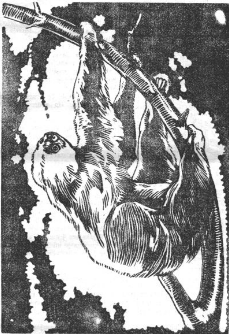
Neobičajen način počivanja. (Lenivec se pri počivanju drži z nogami na deblu ali veji v visečem stanju.)