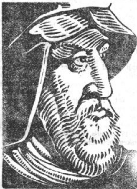
Vojvoda Ernest Železni, zadnji koroški vojvoda.