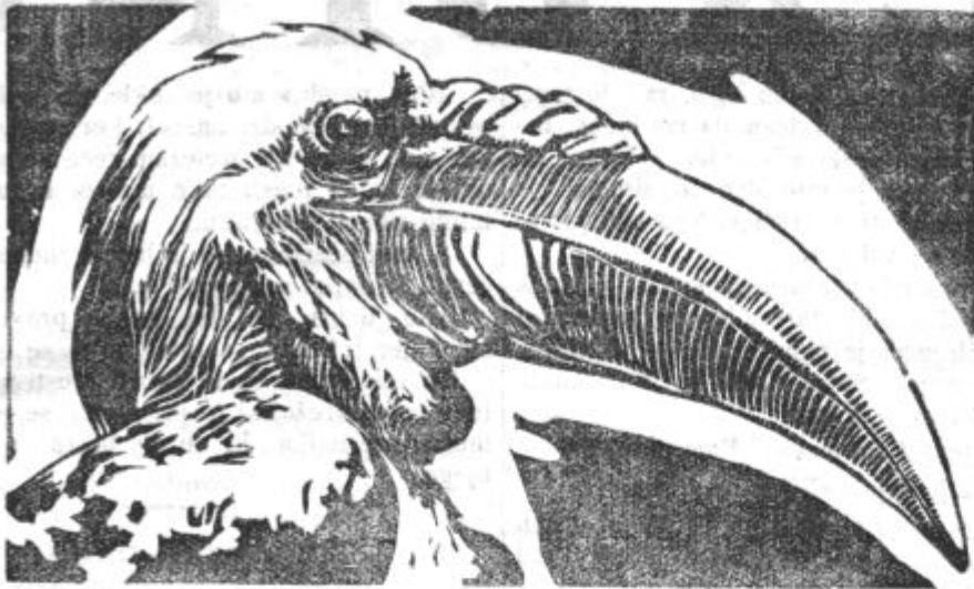
Tako zvana letna ptica. (Živi na Sumatri.)