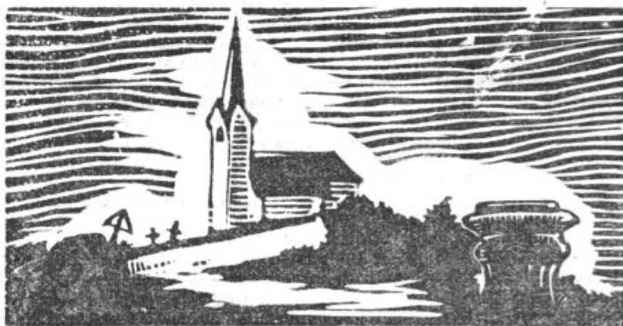
Gosposvetsko polje s knežjim kamnom.

Raba slovenskega jezika pri tem obredu nam izpričuje, da je včasih gospodoval le Slovenec na Gosposvetskem polju in daleč v gornji del Koroške, kjer so danes naši še samo grobovi. Slovenci so tam, ko so izgubili svojo svobodo in prišli pod nemško sužnost, izgubivali vedno več svojih pravic. Vojvoda Ernest Železni (umrl leta 1424.) je bil zadnji koroški vojvoda, ki se je dal umeščiti na Gosposvetskem polju po starem obredu.