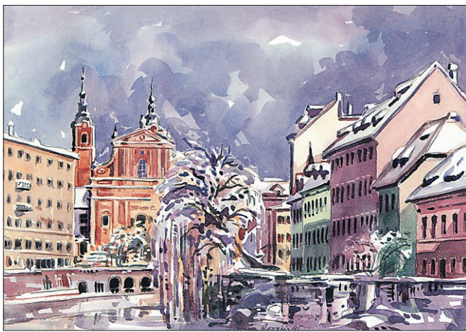
Podoba stare Ljubljane je navdihnila že marsikaterega umetnika

Ta naša prestolnica nudi več, kot vemo, daje, se razdaja, vabi ... Oglejte si jo, se ustavite in sprehodite skozi vrtove Tivolija, si osvežite obraz v