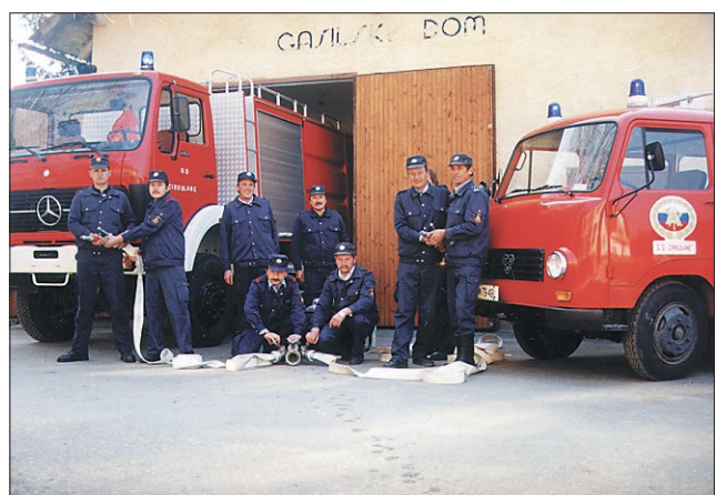
Cirkulanski gasilci so tehnično vse bolj opremljeni

MARKOVCI / RAZSTAVA OTROŠKE KIPARSKO DELAVNICE