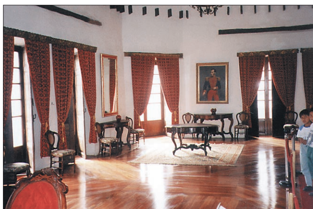
Nekoč Sucretov dom - danes muzej

Ker je, kot kaže, v Južni Ameriki vedno vse obrnjeno na glavo in vsaka logika odpove, sem iz hotela, v katerem sem bil nastanjen, ponovno odšel presenečen. V vseh prejšnjih je v kopalnici skoraj vedno tekla le mrzla voda, tako da sem se ob tuširanju zmeraj tresel in stiskal zobe. V tistem je bilo obratno, hladna voda ni in ni hotela priteči, z vrelo pa je tuširanje še bolj nemogoče.