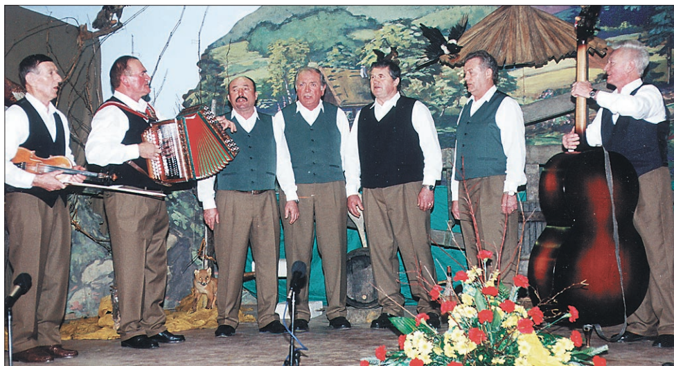
Ljudski godci trio Vetrnica in pevci Male vasi med sobotnim nastopom.