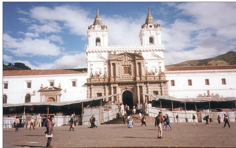
Katedrala v starem emstnem jedru mesta Quito

Quito je glavno mesto Ekvadorja. Z 2850 m je za La Pazom druga najvišje ležeča svetovna prestolnica. Med kolonialnim obdobjem je bilo ob Limi drugo najpomembnejše mesto na celotnem španskem teritoriju. V Quitou živi 1,2 milijona prebivalcev in je šele drugo največje ekvadorsko mesto. V mestu so klimatsko idealne razmere. Kljub bližini ekvatorja zaradi višine ni prevroče, noči pa tudi niso premrzle. Mesto je Unesco