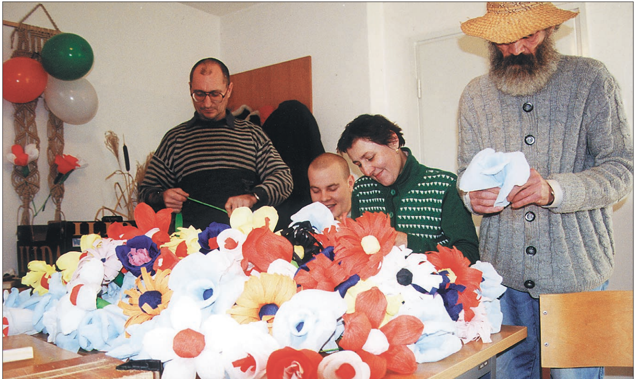
Pisane rože iz krep papirja za lepšo pustno podobo Ptuja.