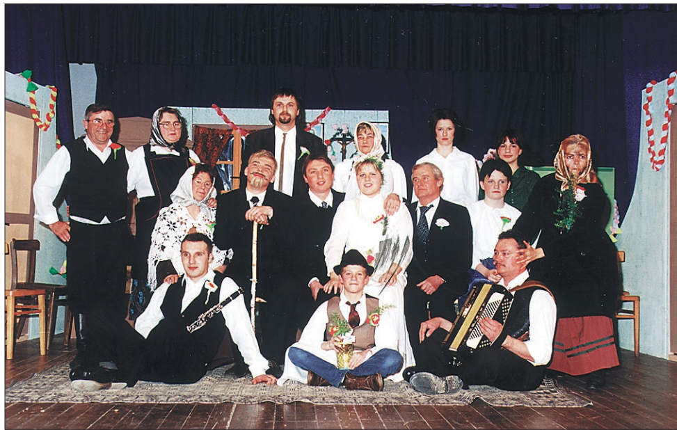
Dramska skupina kulturno-prosvetnega društva Frančka Kozela Cirkulane.

CIRKULANE / NOVA PREDSTAVA DRAMSKE SKUPINE