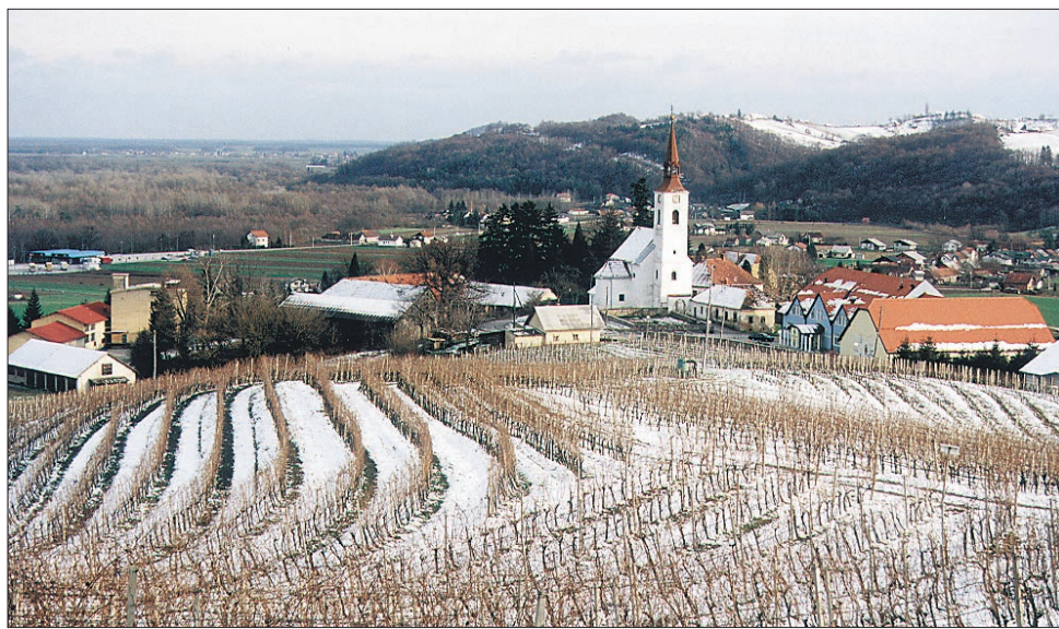
Zavrč v teh dneh ...

Med vlogami občanov so završki svetniki na prvi letošnji seji razpravljali tudi o vlogah za gramoziranje dveh odsekov cest v Turškem Vrhu in sklenili, da bodo to storili v okviru rednega vzdrževanja, brž ko bodo vremenske razmere dopuščale. Sedaj je namreč teren za težja vozila še preveč razmočen. Sicer pa pričakujejo tudi sofinanciranje uporabnikov teh cest.