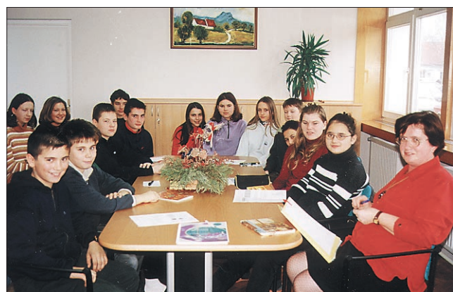
MS Skupina mladih novinarjev