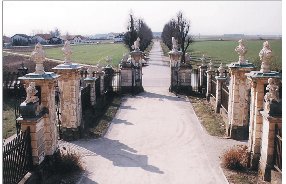
Vhod v slovenski Versailles.

O "slovenskem Versaillesu" so govorili pred drugo svetovno vojno in še poprej, ko so imeli v mislih Dornavo, pri čemer niso mislili na vas, ampak na eno najlepših graščin na Slovenskem.