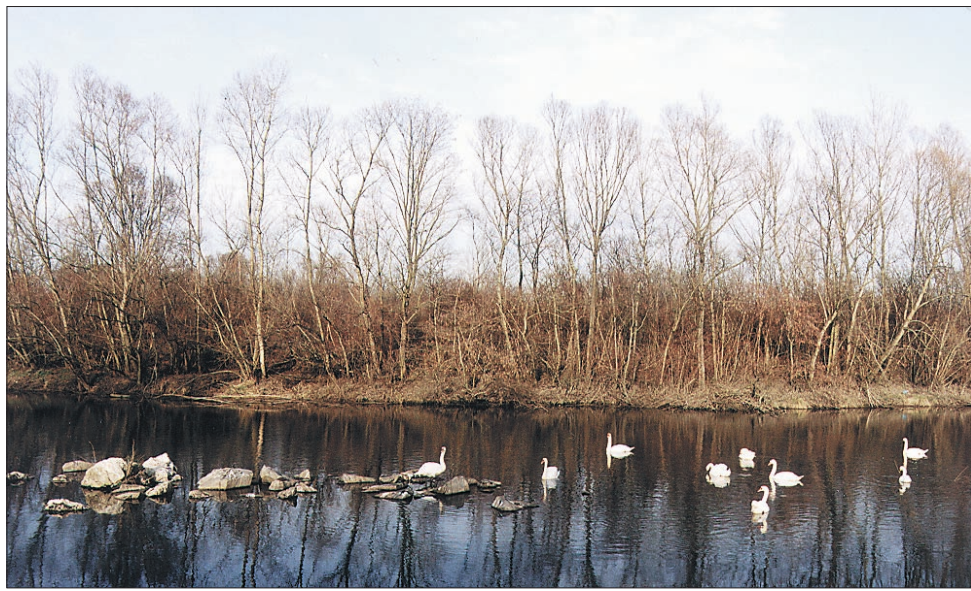
Šturmovska laguna od daleč sploh ni videti nevarna, saj se na njej ustavljajo celo labodi. Le skoraj črna voda in smrad dajeta slutiti, da nekaj ni v redu.

V Markovcih so s samostojnostjo občine poleg obilice pozitivnih žal podelovali tudi nekaj negativnih posledic. Med slednje sodi tudi laguna ob robu Šturmovcev - nekaj sto metrov dolgo in od 10 do 30 m široko umetno jezerce, ki je nastalo ob izkopu gramoza za gradnjo objektov hidroelektrane v Forminu. Razprostira se na dobrih treh hektarih vodnih površin in je za okolje praveca ekološka bomba, saj se v mrtev rokav po trditvah strokovnjakov usedajo strupene usedline odplak in fekalij iz naselja Kidričev in podjetja Talum, del odplak pa tudi iz ptujske čistilne naprave.