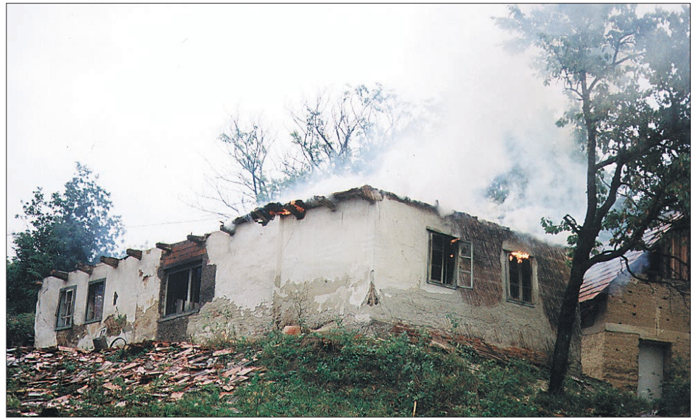
Med 309 dogodki je bilo v letu 2000 kar 232 različnih požarov.

Podrobneje so analizirali naravne in druge nesreče minulem letu 2000, ko se je po besedah vodje centra za obveščanje Francija Krajnc pripetilo 309 različnih dogodkov. Med njimi je bilo daleč največ - kar 232 - različnih požarov. V 112 primerih je zagorelo v naravnem okolju, v 50 primerih je izbruhnil požar na raznih objektih, 43 je bilo drugih požarov, v 27 primerih pa so zagorela prometna sredstva. V zadnjih