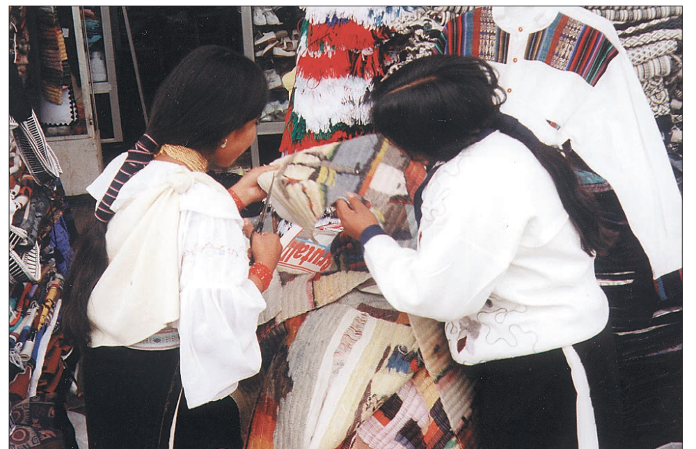
Mladenkam je bilo zaradi mojega fotoaparata nekoliko nerodno; fotografirano na eni od tržnic v Cuenci