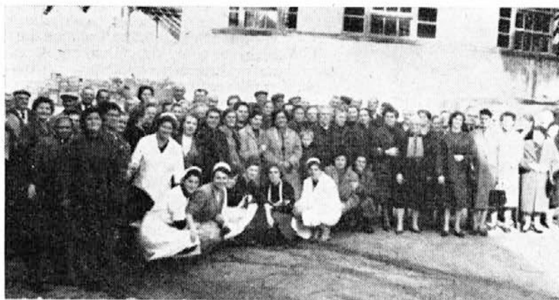
Ob sprejemu upokojencev na dvorišču v obratu Argo