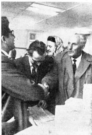
Tovariši Tore se v imenu upokojencev zahvaljuje za darila

Tudi to področje dela narekuje vzgojo našega delovnega človeka, da bo sam kos vsem pojavom, ki mu stopijo na njegovo življenjsko pot.