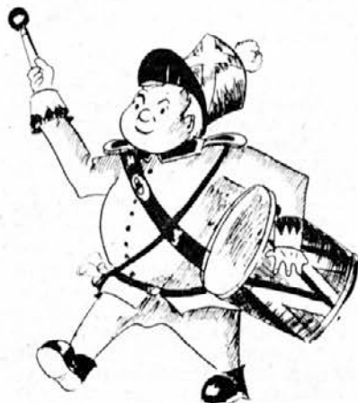
Predlog za razglasno postajo

Infekcija se prenaša s kapljicami, ki jih izločamo pri kihanju, kašljanju ali govorjenju. Prenese se pa tudi preko pisem, denarja itd. Zato se gripa lahko tudi »uvozi« in smo že imeli azijsko in špansko gripo.