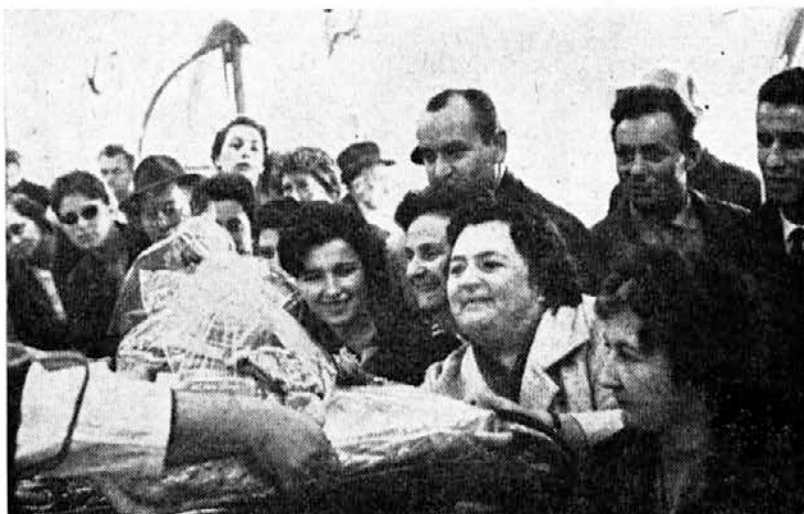
Prva nakupovalka v novi ribarnici prejema darilo kombinata

Skupni stroški ureditve nove ribarnice v Ljubljani so znašali brez opreme okoli 25.000.000 din. Naš kombinat je kot soinvestitor vložil za ureditev ribarnice skupaj okoli 9.560.000 din, poleg tega so znašali stroški za načrte in za nadzorstvena dela še približno en milijon 200.000 din, oprema ribarnice pa okoli 1.800.000 din, torej manj, kot je bilo predvideno in odobreno po delavskem svetu, saj je le-ta odobril za opremo 2 milijona 500.000 din. Če torej seštejemo vse stroške, nastale v zvezi z ureditvijo nove ribarnice v Ljubljani, vidimo, da nas je le-ta stala okoli 12.560.000 din, ostala sredstva pa je investirala uprava trgov v Ljubljani, v čigar organizacijski sestav ribarnica tudi sodi. To res ni majhna investicija, toda že danes ugotavljamo, da je bila zelo potrebna za normalno preskrbo ljubljanskih potrošnikov z ribami, prav tako pa tudi našemu kolektivu, saj bo čvrst akumulativen člen v verigi naše razvijane gospodarske dejavnosti.