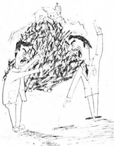
Za sv. Petra so drva, za nas pa ne

Če bi zamudnike navedli poimenočno, bi bili zelo, zelo užaljeni, saj bi jim to vzelo vsakršno pravico nastopati in govoriti o delovni disciplini, ker bi v taki razpravi sami zdrknili na zatožno klop. Nekateri predlagajo, naj bi bil seznam zamudnikov javno izobešen kakor odločbe o kaznih, ki jih izreka disciplinska komisija. Naj bodo ukrepi proti zamudnikom takšni ali drugačni, biti bodo morali toliko učinkoviti, da bodo ozdravili vsaj kronične zamudnike.