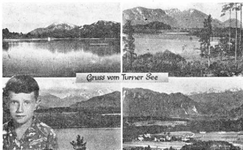
Pozdrav s Turnerskega jezera