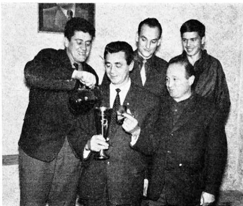
Na sindikalnem tekmovanju strelskih ekip je naša petorica osvojila prehodni pokal

Izkoriščam to priložnost in želim vse članom kolektiva srečno novo leto 1964!