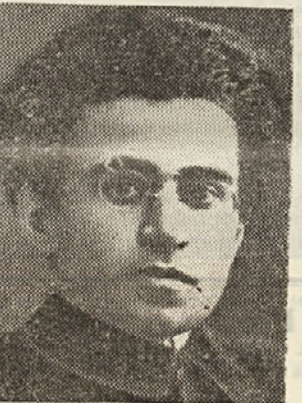
Antonio Gramsci, ustanovitelj KPI

Zadnjič smo zaključili članek s tem, da smo prikazali stališče socialistov ob priliki vstopa Italije v prvo svetovno vojno.