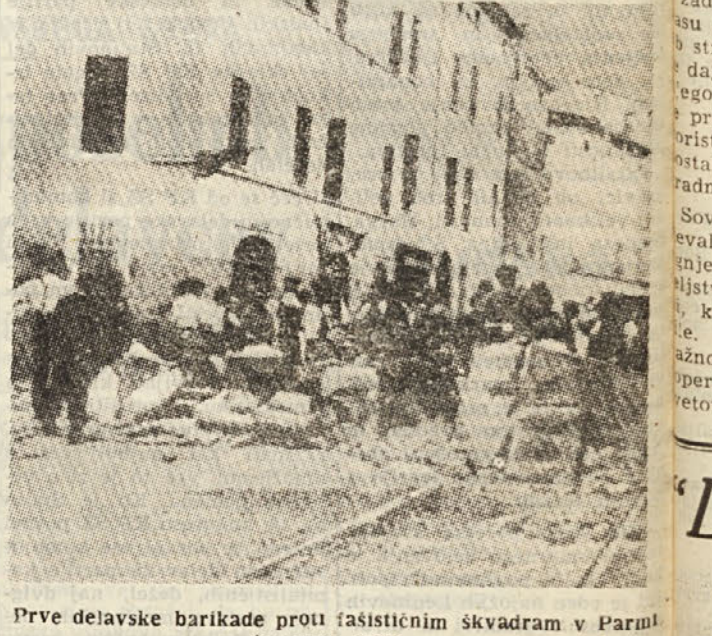
Prve delavske barikade proti fašističnim Skyvdram v Parolu (avgusta 1922)

Italijanske revolucionarne delavske množice niso dobile v stranki svoj pravo pot, po kateri bi morale biti vodene, če bi stranka imela marksistično vzgojo.