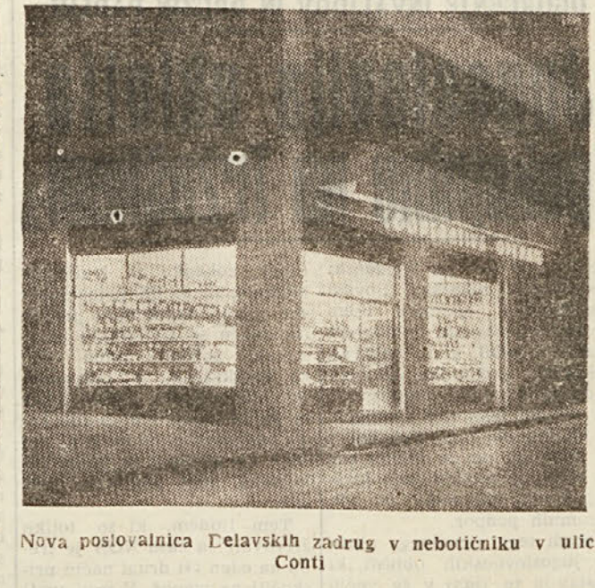
Novo poslovalnica Delavskih zadrug v nebotičniku v ulici Conti