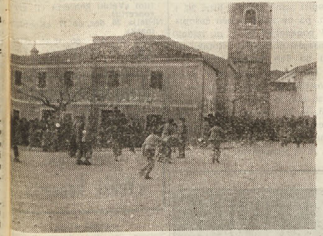
Lučanje Sv. Štefana lani v Boljuncu