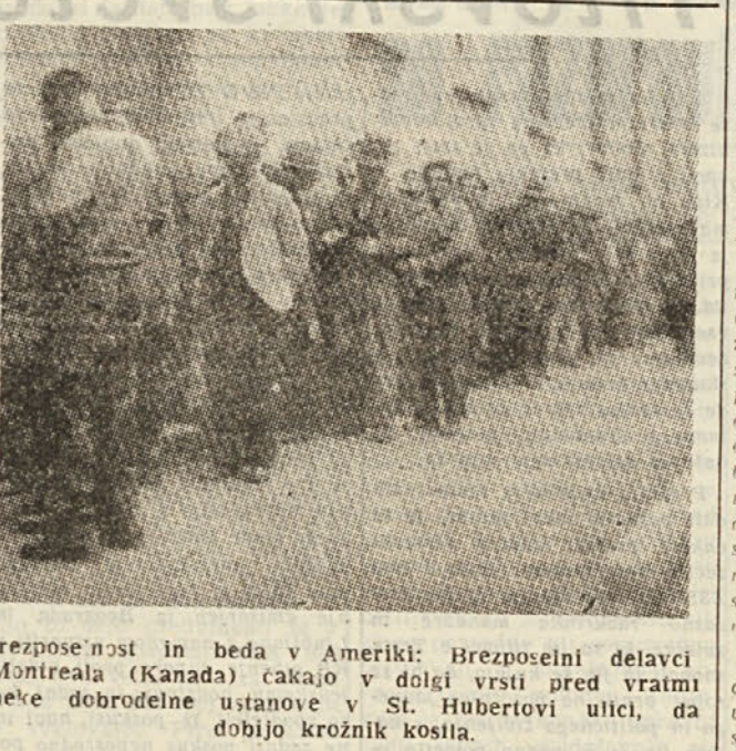
Brezpoveznost in beda v Ameriki: Brezposelni delavci Montreala (Kanada) čakajo v dolgi vrsti pred vrtni koke dobrodelne ustanove v St. Hubertovi ulici, da dobijo krožnik kostja.

Nad tisoč raznih kosov oblačil za moške in ženske, kožuh, pokrivala, ki so sedaj razstavljeni v Moskvi na neki razstavi, prikazujejo napredek, ki so ga napravile tovarne postrojnih predmetov v razširitvi svoje proizvodnje in v zboljšani kakovosti.