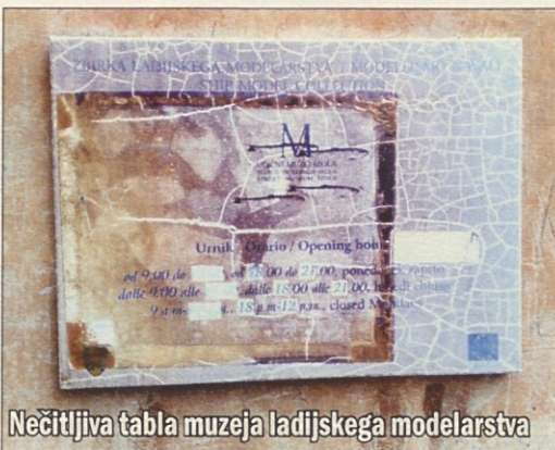
Nečitljiva tabla muzeja ladijskega modelarstva

Zgodilo se je na petek, 13. a niti to ni bilo dovolj, da bi pokvarilo dobro vzdušje ob gledališki operi Gaetana Donizetti: Ljubezenski napoj. Gostovala je mednarodna opera iz Križa pri Trstu, ki jo vodi Alessandro Švab. Melodiozna in zžečkljiva melodrama velja zaradi preproste ljubezenske zgodbe za eno najpogostejše izvajanih Donizettijevih oper, pri čemer velja izpostaviti predvsem estetski moment lepote melodij. Gaetano Donizetti velja poleg Bellinija in Rossinija za utemeljitelja italijanskega opernega belcanta in na petkovi predstavi ga je bilo več kot dovolj.