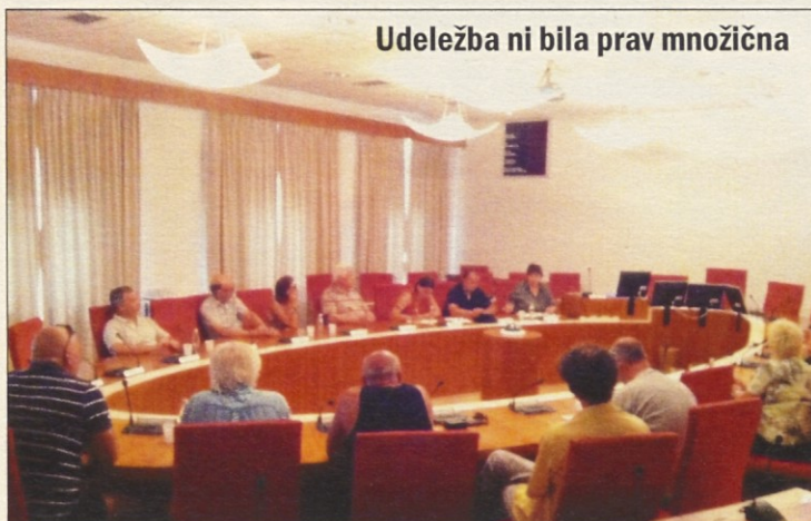
Udeležba ni bila prav množična

Predvsem bode v oči, da bi na ta način krajanje lahko preprečili dostop do tega dela Izole tudi ostalim Izolanom.