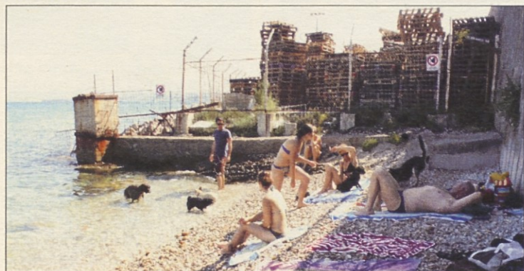
Pasja plaža: sobivanje človeka in njegovega najboljšega prijatelja

Poslovni izidi vseh gospodarskih družb obalno kraškega območja kažejo, da so ustvarile 4,148 milijarde evrov prihodkov in so leto 2011 zaključile s pozitivnim rezultatom. Od treh obalnih občin so gospodarske družbe Mestne občine Koper ustvarila za 2,933 milijarde evrov prihodkov (indeks 103), tiste s sedežem v piranski občini so zmanjšale prihodek za več kot 30 milijonov (skupaj ustvarjenih 315.500 milijonov Eur), gospodarske družbe v izolski občini pa so zmanjšale prihodek za 5,5 milijonov Eurov in ustvarile 243.991 milijonov Eurov. Zanimiv je še podatek, da Izola in Koper lani nista zabeležili neto čiste izgube, zato pa so v piranski občini zabeležili slabih 25 milijonov čiste izgube, večino tega pa so pridelali prav v gostinstvu.