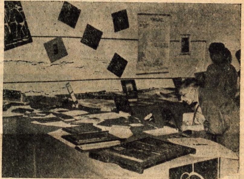
Razstava POT V POKLICE je vzbudila živahno zanimanje med mladino