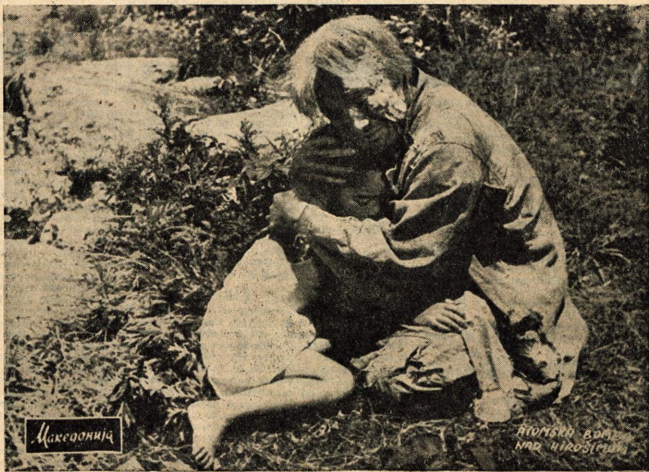
ATOMSKA BOMBA NAD HIROŠIMO je naslov japonskega filma, ki ga bomo v kratkem gledali. V teh dneh, ko ves svet protestira proti nadaljevanju poskusnih eksplozij atomskih bomb, ko se drug za drugim vrstijo pozivi državnikov, znanstvenikov, atomskega orožja, je ta film še zlasti zdravnikov, delavskih sindikalnih organizacij po vsem svetu, ki zahtevajo me, mesta, v katerem je v enem sa-prenehanju poskusov in prepoved mem trenutku umrlo 247.000 ljudi.

Naposled se je naveličal pripovedovati o vseh teh dolgočasnih stvareh in je speljal pomenek nazaj na lov, od lova pa na dekleta. Dominik se mu je smejal, zdelo se mu je, da je izvedel dovolj in napol je že sklenil, da se bo odpeljal v Gradec in poskusil srečo. Če uspe, bo na konju, če se mu ne posreči, bo izgubil samo voznino. Delati tako ne more, ker ima ranjeno roko.