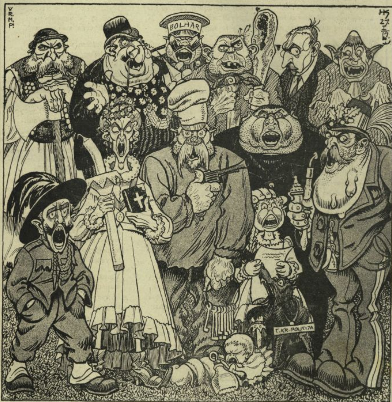
Jugoslovanski bolševiki in drugi.