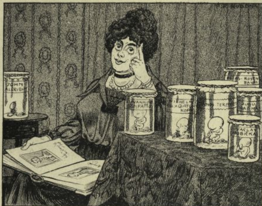
Njeni uspehi za časa svetovne vojne.