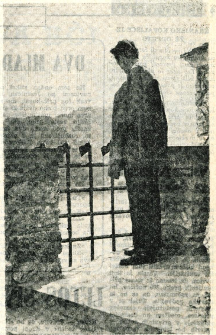
NA BLEJSKEM GRADU

Koristnost nagrajevanja po učinku se kaže tudi v povečanju osebnega dohodka na posameznika. Na področju škofjeloške občine je osebni dohodek lani v primerjavi z letom 1958 porasel na prebivalca za 3.000 dinarjev.