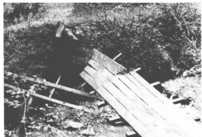
Pojdite na sprehod (če znate frčati)