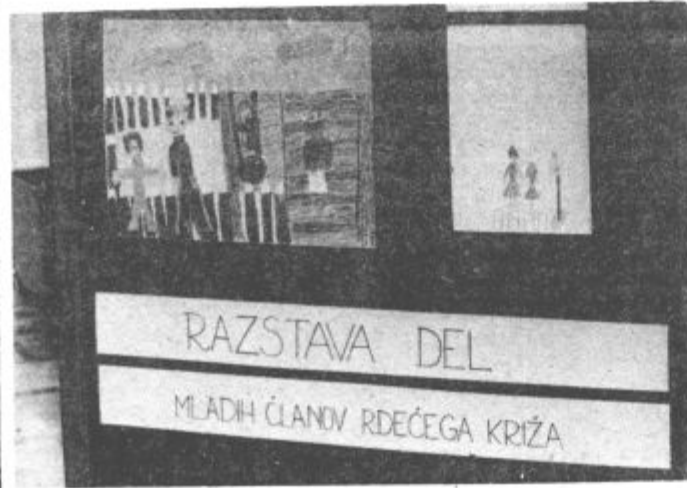
Mladi člani Rdečega križa so pripravili zanimivo in pestro razstavo o dejavnosti v tej humanitarni organizaciji

Z novim kolektorskim letom so se mladi člani Rdečega križa vključili še v republiško akcijo nudenja sosedskih pomoči. Ta dejavnost za nekatere šole velenjske občine ni nova, zato bodo letos na tem področju še zavzete delali. Vodilo pri tej akciji jim ni končna uvrstitev, ampak human odnos do človeka, ki je potreben pomoči. V tednu Rdečega križa sprejmejo v svoje vrste učence prvih razredov, sedmošolci pa postanejo člani krajevnih organizacij Rdečega križa, kjer pač te delujejo. »Žal imamo največ težav pri vključevanju v mestu, saj prav tu ni ustanovljena niti ena krajevna organizacija Rdečega križa,« je potarnala sogovornica in nadaljevala: »Mentorji mladih članov na vseh šolah velenjske občine so zelo prizadevani. Vsako leto vestno izpolnjujejo naloge. Prav gotovo je po njihovi zaslugi ta dejavnost na vseh osnovnih šolah tako živa in pestra.«