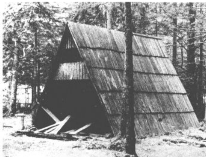
Okrepčajte se (če želite shujšati)

beti — planinci. Ne tisti, ki te obiskujejo in občudujejo, pač pa oni, drugi, ki te izkoriščajo. Seveda tudi tisti gostje, ki te le bežno obiščejo in ti v spomin zasvinjajo tvoja nedrja z vsemogočimi „dobri-nami“. Toda ti se menjajo, prvi pa ostajajo. Smo sploh še ljudje, prej vse kaj drugega.