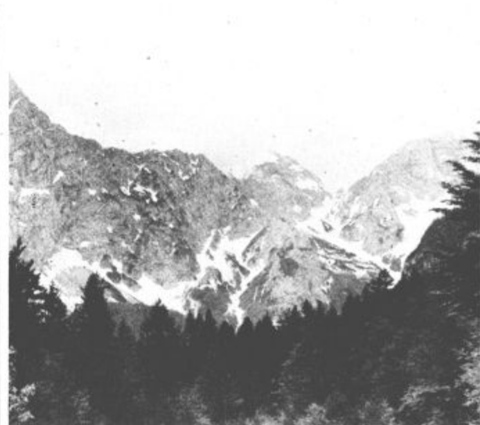
Logarska: vseeno si lepa