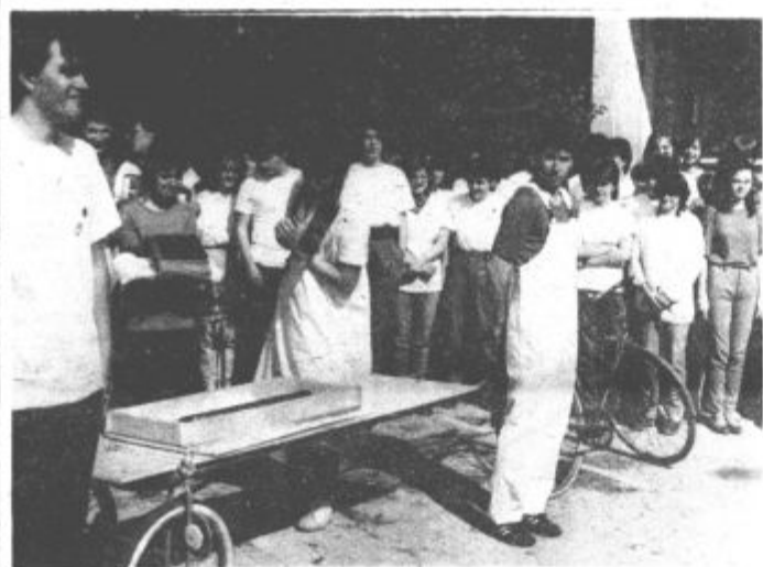
Zadnji maturantje ključa niso izročili tretješolcem, saj je padel pod udarce šolske reforme. Pokopali so ga pred vhodom nekdanje gimnazije.