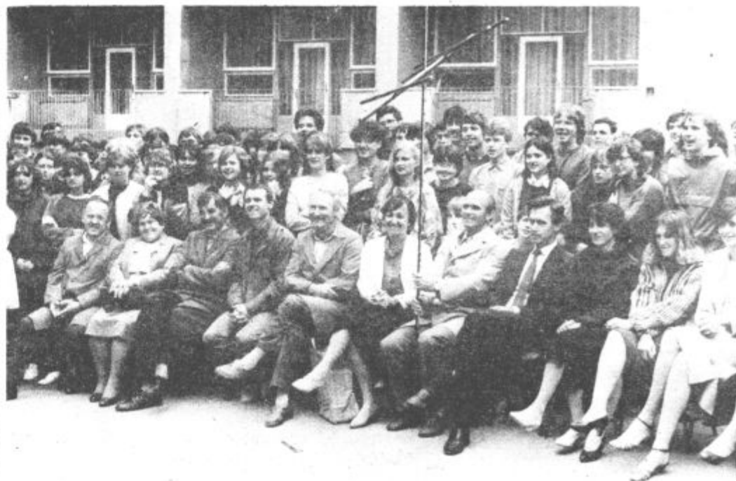
Tudi zadnji maturantje so se poslovili od svojih profesorjev s šaljivimi darili. Ravnatelj so kot prispevek za posodobitev izobraževanja s sodobnejšimi učnimi pripomočki podarili televizijsko anteno.