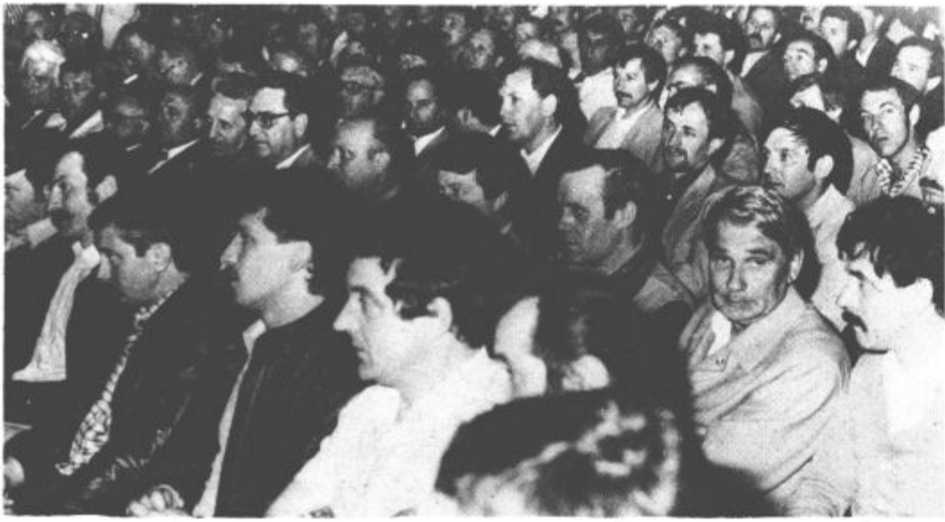
Reševalne vaje in proslave so se udeležili reševalci iz vse Slovenije, prišli pa so tudi predstavniki hrvaških rudnikov Raša in avstrijskega Bleiberga