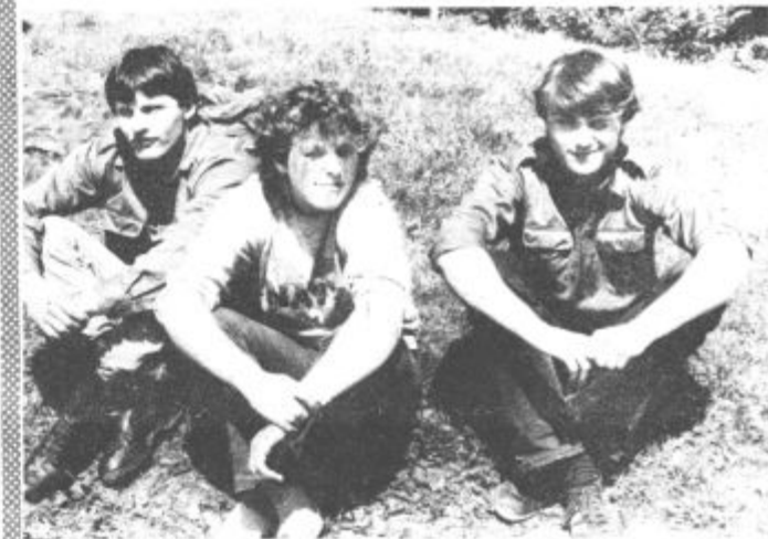
Zmagovalna ekipa mladinske organizacije iz Šentilja