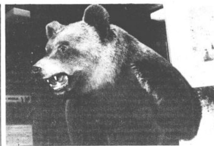
»Zvezda« razstave je vsekakor kosmatinec, ki je lani lovcom povzročil obilo preglavic

Na slovesnosti so podelili visoka lovška priznanja številnim posameznikom ter družbenim in delovnim organizacijam s katerimi lovci tvorno sodelujejo.