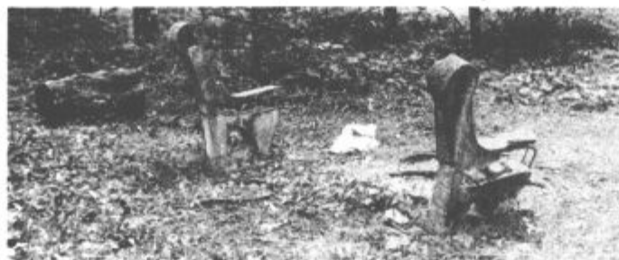
Oddahnite si na klopci (prinesite jo s seboj)