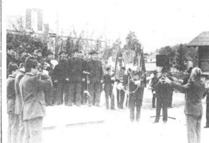
Z lovskimi pesmimi so se predstavili pevci in rogisti