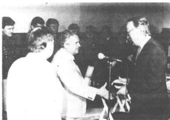
Dosedanjim vodjem jamske reševalne čete so podelili posebna priznanja