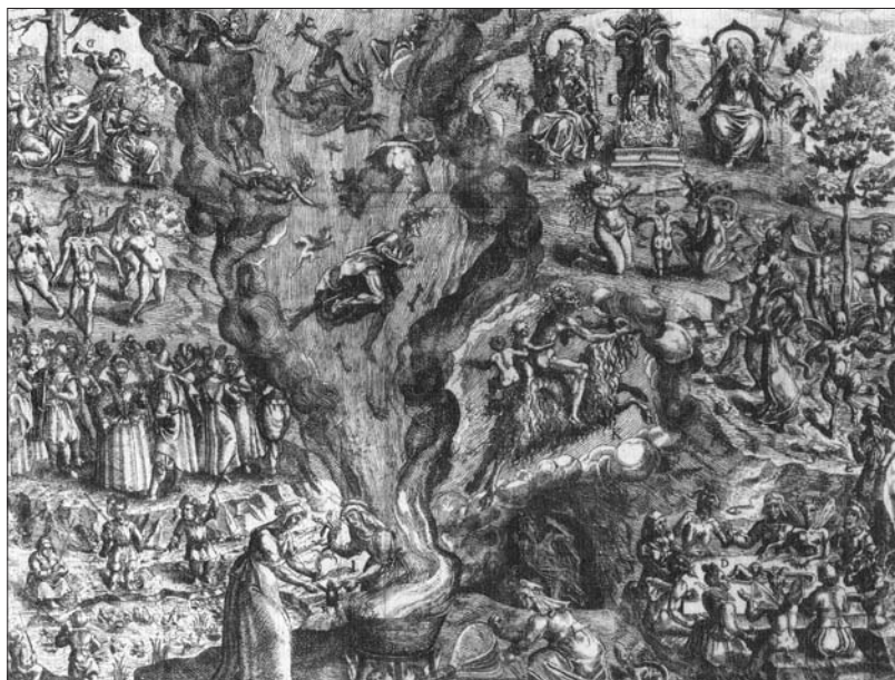
Upodobitev čarovniškega sabata (Pierre de Lancre's Tableau de l'inconstance des mauvais anges et demons (1612)). Avtor upodobitve je poljski graver in slikar Jan Ziarnko. Hudič sedi na prestolu, obdan z najljubšimi čarovnicami.

Čaravnice so mu pripeljale žrtvovat otroka, na desni sta upodobljena čarovniška pojedina in ples, čaravnici v sredini kuhata točo, nad njimi pa letajo čaravnice in demoni.