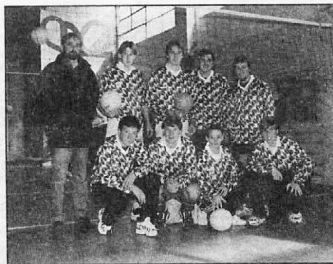
Zmagovalci pri fantih: San Justo

Izid tekmovanja za fante so bili sledeči: Ramos Mejía 2 - Carapachay 1 (19:25, 26:24, 15:13); Lanús 0 - Morón 2 (23:25, Nad. na 4. str.