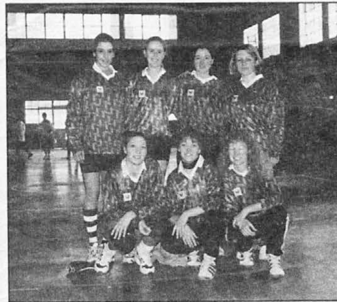
Zmagovalke pri dekletih: San Martín

Za vse tiste, ki se niste mogli udeležiti sanmartinskega mladinskega dne, vam prilagamo seznam moštev in rezultate: