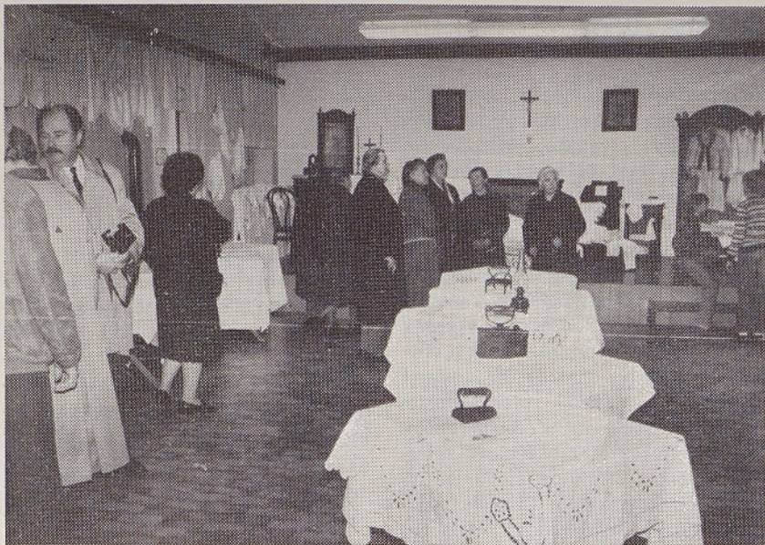
15. novembra so v Mačkovljah odprli razstavo starih vezenih in kvačkanih izdelkov