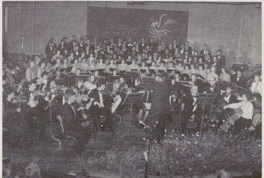
Gregorčičeva proslava v Gorici: izvajalci kantate »Jeftejeva Prisega«

Rojaki v Argentini so se spomnili Gregorčiča s proslavo 5. oktobra na Slovenski pristavi v Castelarju.