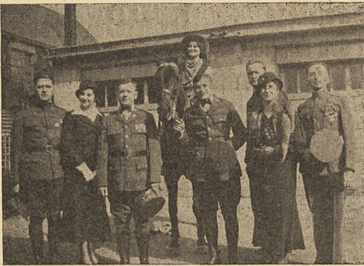
“Teta na konju” kakor so jo prikazali igralci pri Sv. Lovrencu v Clevelandu, O. pred zadnjo vojno