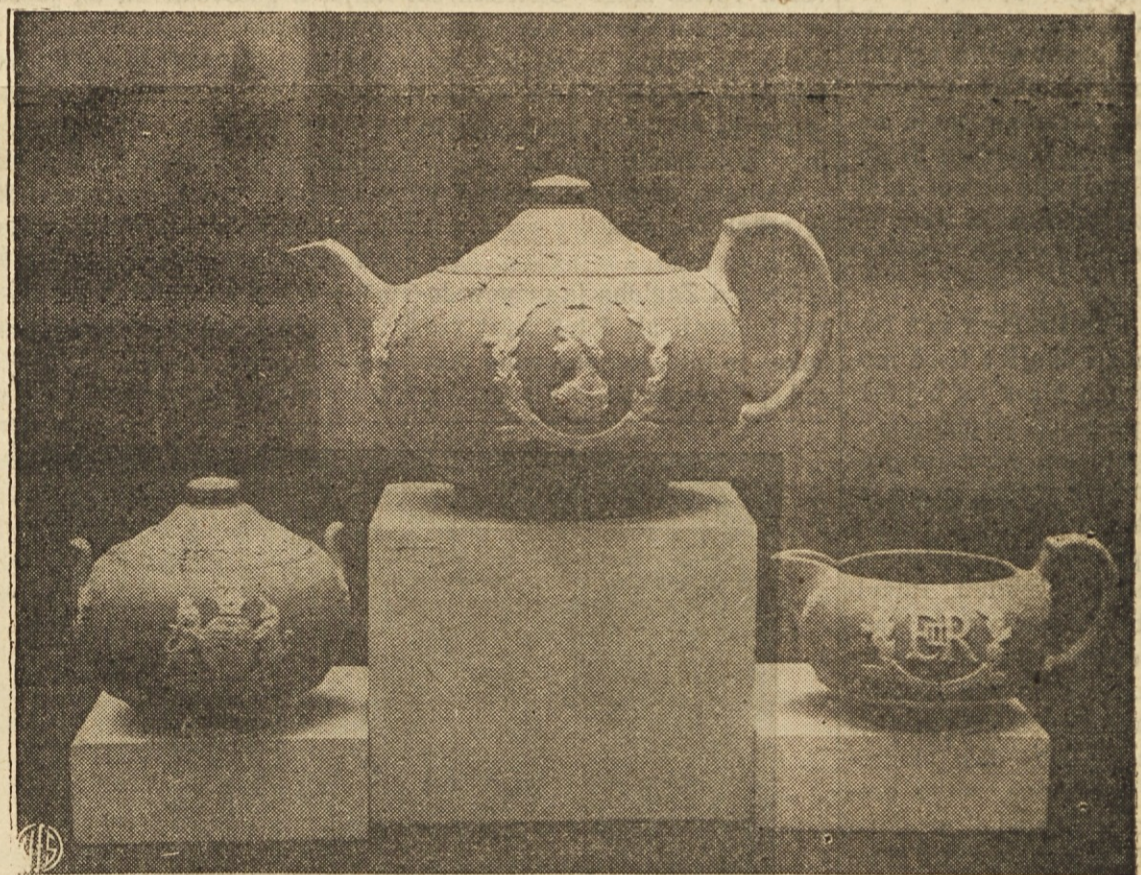
NA KRONANJE — Tale vrč za čaj in posodi za sladkor in mleko so med lončarskimi izdelki, ki jih je izdelal Josiah Wedgwood v čast kronanja angleške kraljice Elizabete II. Takile izdelki pa so predvideni samo za kanadski in ameriški trg. Na Angleškem jih ne bo moč kupiti.