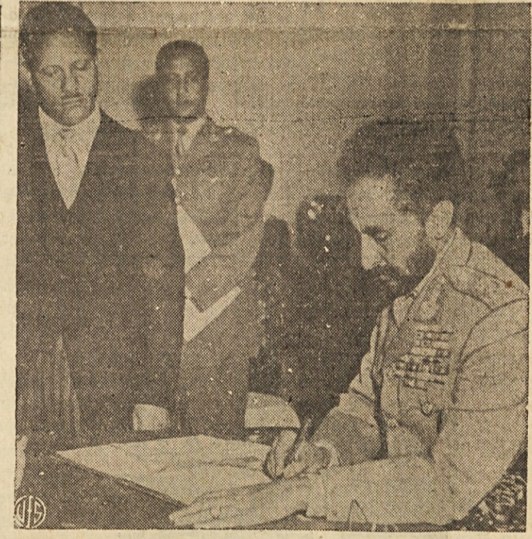
ERITREJA SE JE PRIKLJUČILA ABESINIJ — Abesinski cesar Haile Selassie podpisuje novo ustavo nekdanje italijanske kolonije, ki se je sedaj priključila Abesiniji.

NEW YORK. — Konvencija Ameriške delavske federacije zahteva za vsakega delovnega človeka najmanj $1.25 plače na uro.