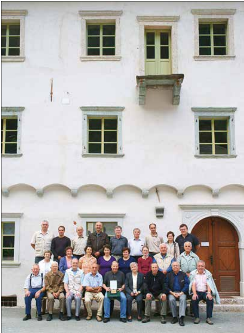
Del Muzejskega društva, avgust 2009.