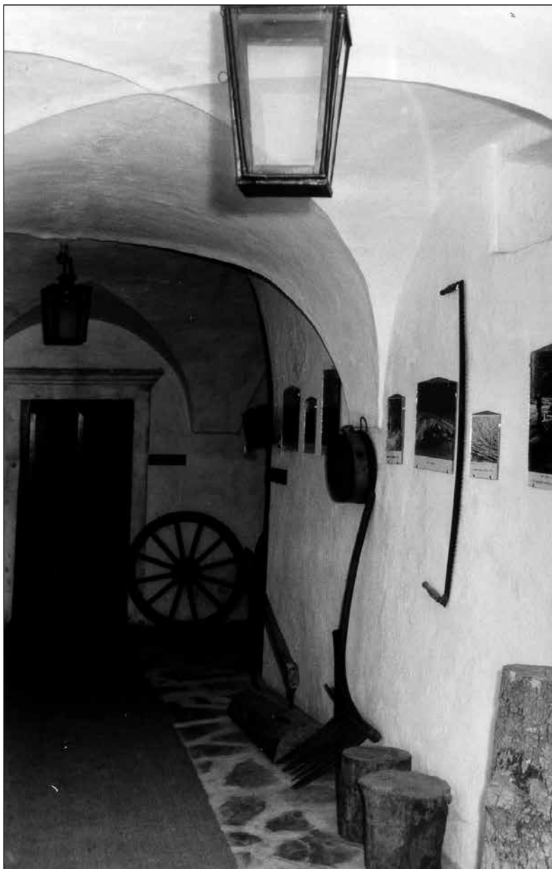
Del hodnika v 1. nadstropju leta 1970 z nekaterimi predmeti.