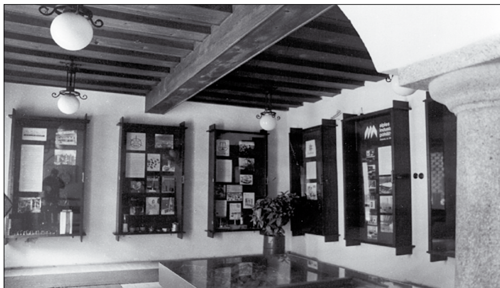
Vstopna soba muzeja ob otvoritvi. Vitrine delovnih organizacij iz Železnikov - pokroviteljev muzeja: Niko, Iskra, Tehnica, Čevljarna Ratitovec, Alpes. Spodaj viden tudi relief Selške doline.