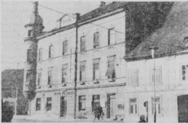
Hotel »Planina« v Slov. Bistrici