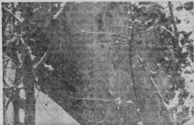
Ob vhodu v Balunječo so res le ledeni kapniki, v netranjosti pa so tudi pravi

času je zelo prijetna. Potok, ki priteka iz jame je bivša rudniška uprava koristno uporabila, saj so zgradili zajetje, iz katerega je potem