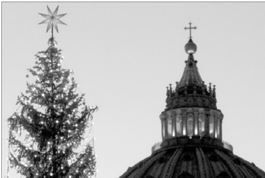
Včeraj so prižgali lučke na vatikanskem božičnem drevesu

»Katoliška cerkev v Rusiji ponuja pastoralno oskrbo katoličanom v tej državi, ne želi pa spreobračati pravoslavnih vernikov,« je novinarjem povedal glavni avtor dokumenta, kardinal William Joseph Levada. Odnosi med rusko pravoslavno cerkvijo in Svetim sedežem so zaostreni tudi zaradi očitkov moskovskega patriarhata o katoliškem misijonarjenju v tradicionalno pravoslavnih državah, ki je sledilo razpadu nekdanje Sovjetske zveze. Odnosi so se sicer poslabšali že leta 2002, ko je Vatikan v Rusiji vzpostavil štiri svoje škofije. Včeraj objavljeni dokument pravi, da so v Cerkvi dobrodošli tudi nekatoliški kristjani. (STA)