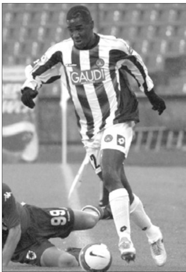
Pred prihodom k Udineseju je kolumbijski branilec Cristian Zapata igral za ekipo Deportivo Cali

Ob vznožju Etna je namreč treniral in zaključil agonistično pot - Nocoj še Lazio proti Juventus