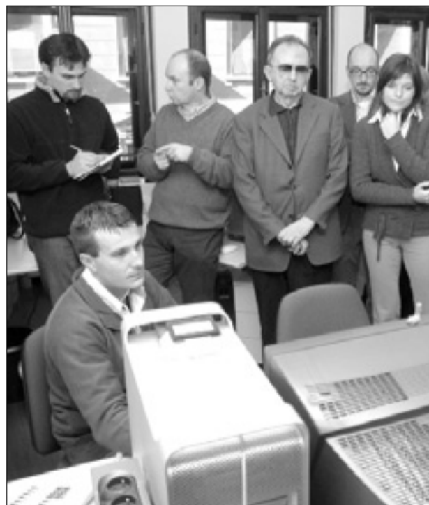
Publika krstne predstavitev nove spletne strani