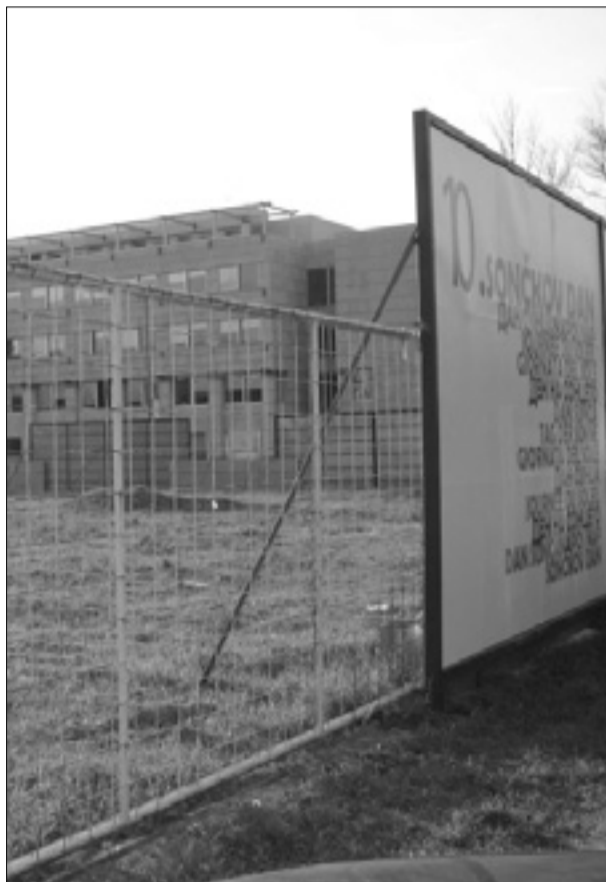
Lokacija Eda centra je danes le ograjeno zemljišče