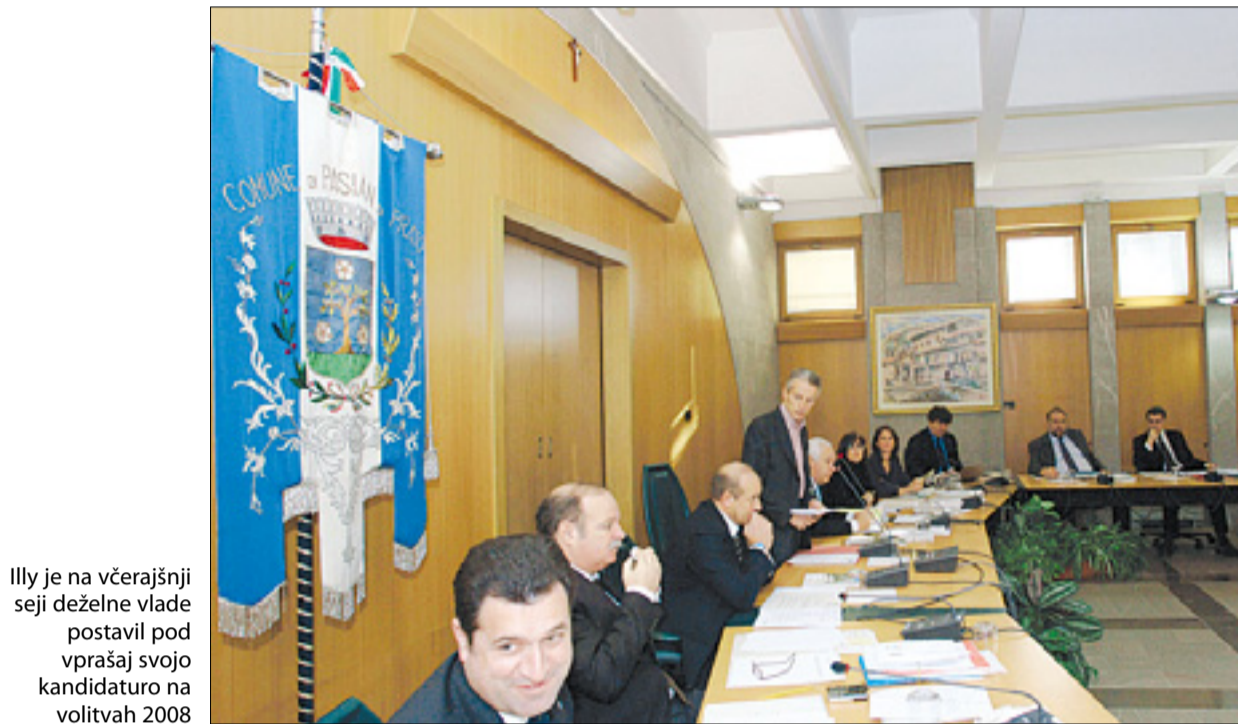
Illy je na včerajšnji seji deželne vlade postavil pod vprašaj svojo kandidaturo na volitvah 2008

Janša se s Sanaderjem o ERC ni pogovarjal, so za STA potrdili tudi viri blizu predsednika vlade. Premier Janša za zdaj nima predvidenih pogovorov o tej temi, so povedali. (STA)