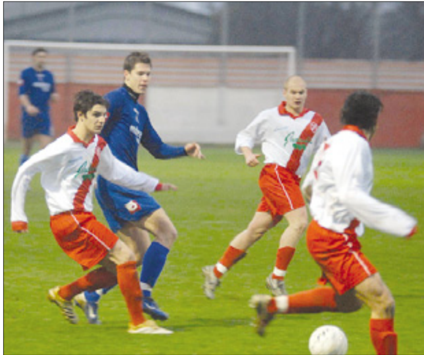
Juventina za sedmi zaporedni pozitivni izid

Vesna v Pordenonu brez Venturinija - Juventina v Sevegliau z Devetakom in Liutom