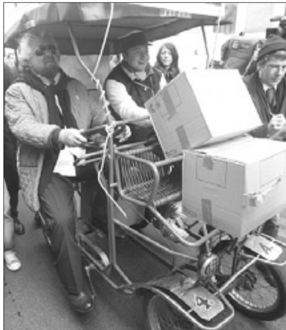
Beppe Grillo na rikšoj

Grillo pa se ni pritoževal samo nad politiko, ampak je nekaj pikrih besed namenil tudi informaciji, ki naj bi bila vzrok prave depresije, v kateri se je znašla država. Po njegovem mnenju sodobna informacija napaja ljudi z neumnostmi in je zaradi svoje omejenosti obsojena na smrt; na njenem mestu se bo uveljavil splet, ki naj bi bil izredno demokratičen vir.