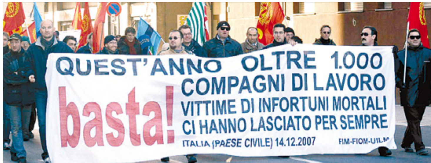
Včerajšnji sprevod delavcev po tržiških ulicah

Na krožišču Anconetta je prišlo do dolgih kolon - Voznike mirila policija