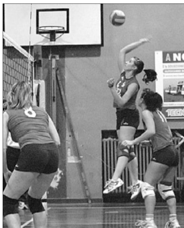
Slogašice bodo danes na Opčinah naskakovale tretjo prvenstveno zmago