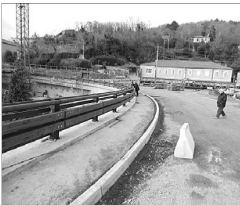
Nov ovinek Furlanske ceste pri Rumeni hiši

Tako bo omogočeno demontiranje Baileyevega mostu brez zaprtja pomembne prometnice