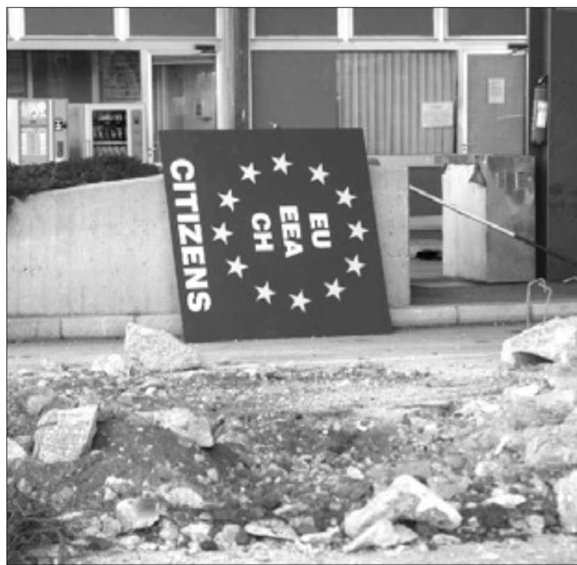
Podlipnik in Podbersig na kraju rušenja mejnih objektov (desno), z nadstreškov so umaknili napise (levo)

Stroške za odstranitev ovir bodo krili iz fonda civilne zaščite - Družba SDAG bo okrepila zmogljivosti postajališča