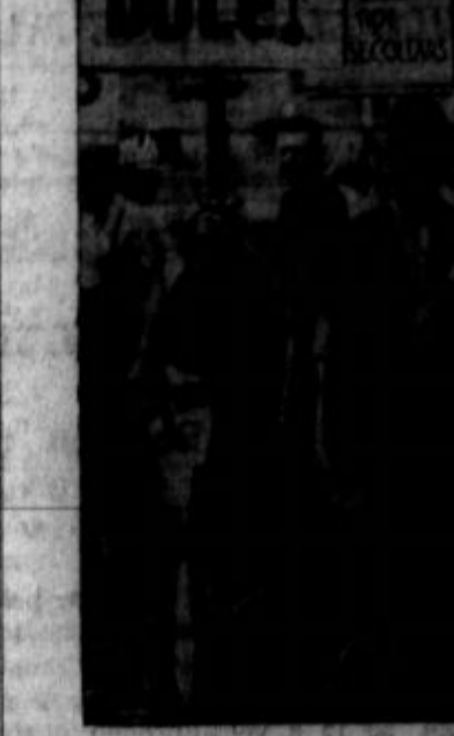
Protestne demonstracije proti odalovitvam religij delavcev pred uradom WPA v Detroitu.

Dve prireditvi SDD Detroit, Mich. — Človek bi skorje ne verjel, da je pikniška