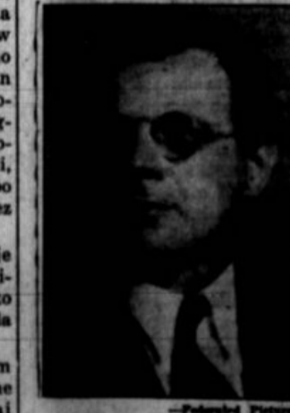
Sidney Hillman, predsednik krojaške unije Amalgamated Clothing Workers.