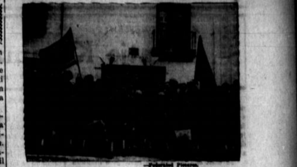
Člani ameriške brigade, ki se borijo na strani vladnih milicinkov na madridski fronti.

Pri spopadu l. 1932 evropski Šanghaj ni bil prizorišče bojev med Kitajci in Niponci, toda takrat se niso v zadostni meri sodelovala bojna letala. Zdaj se Niponci poslužujejo tudi letal. Tako se zna zgoditi, da bo evropski Šanghaj s svojimi palačami kmalu zapuščeno mesto. Če se Niponcem posreči, da zavzamejo Šanghaj, oziroma če ga bodo Kitajci rešili — od tega je odvisna usoda osrednje kitajske vlade v Nankingu, oziroma usoda niponske moči v vzhodni Aziji. Zis.