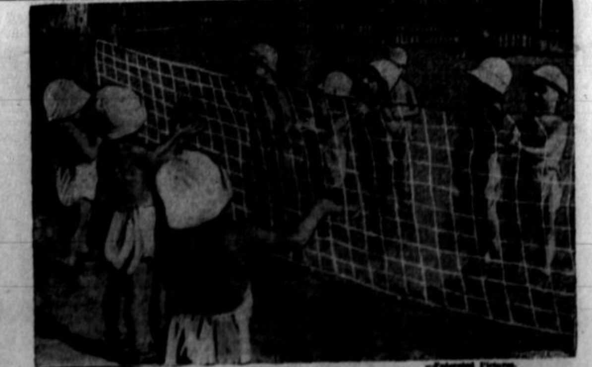
Slika kaže eno izmed mnogih otroških igrišč, ki jih je sovjetska vlada zgradila v Moskvi.

Goering in poslušalci so mu viharno aplavdirali. "Nemčija je danes zedinjena in disciplinirana. Ponovno smo oživilo militaristično voljo in nemški narod je pripravljen na obrambo pred sovražniki. Vi, ki živite zunaj Nemčije, morate ob vsaki priliki naglašati, da ste Nemci in nacija. To je vaša pravica in dolžnost, kajti Nemčija je osvobodila filozofijo nacionalističnega socializma. Pripravljeni morate biti na žrtve, ki jih domovina zahteva od vas. Domovina je prva v vseh ozirih, potem pride drugo. Pripravljeni morate biti tudi na prelivanje krvi, če to zahtevajo interesi in blaginja domovine."