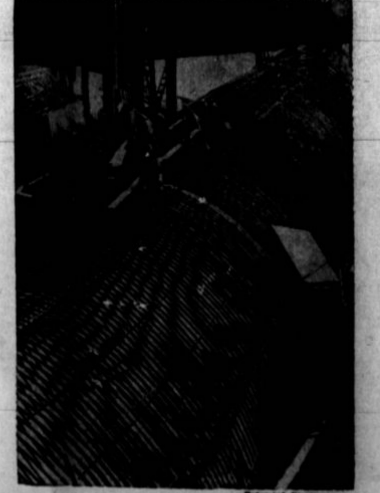
Ogromne vodne cevi oh rekli Columbia v državi Washington, kjer federalna vlada gradi jez,