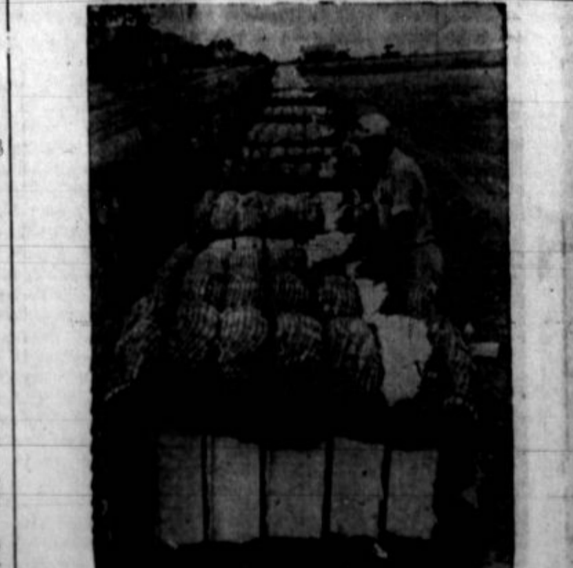
Južne države bodo letos pridelale velike količine bombaža. Ta slika je bila vzeta v okraju Ellis, Tex.

Glavno je, da delavec in mali farmar vsta, kaj hočeta. Ko to vsta, hosta hotela isto — kontrola nad produkcijo vseh dobrin in pre- tvoritev produkcije za torabo namesto za pri- vatni profit!