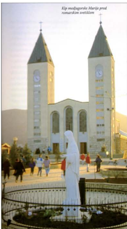
Kip medjugorske Marije pred romarskim svetiščem

željo, da bi bili priča kakšnemu čudežnemu dogodku. Drugi pa romajo, da bi si izprosil kakšno milost, zdravje, ureditev družinskih razmer, delo ali zaposlitev