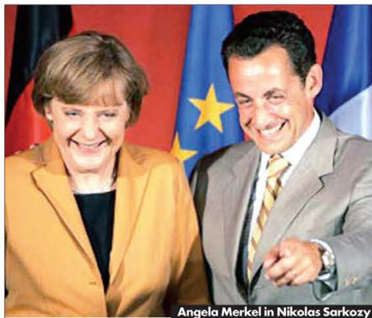
Angela Merkel in Nikolas Sarkozy

52-letni novi francoski predsednik Nikolas Sarkozy, sin madžarskega priseljence v Franciji, je, kot znano, v drugem krogu volitev, 6. maja, prejel 53% glasov, njegova tekunica, socialistka Segolene Royal, pa je zbrala 47 odstotkov. Politično pripada desno usmerjeni Uniji za ljudsko gibanje (kakor dosedanji predsednik Jacques Chirac), vendar iz njegovih izjav izhaja, da želi biti odprt do vseh. Za novega predsednika vlade je imenoval izkušeno politika, 52-letnega Francoisa Fillona, ki je v nekaj dneh sestavil novo vlado na osnovi smernic