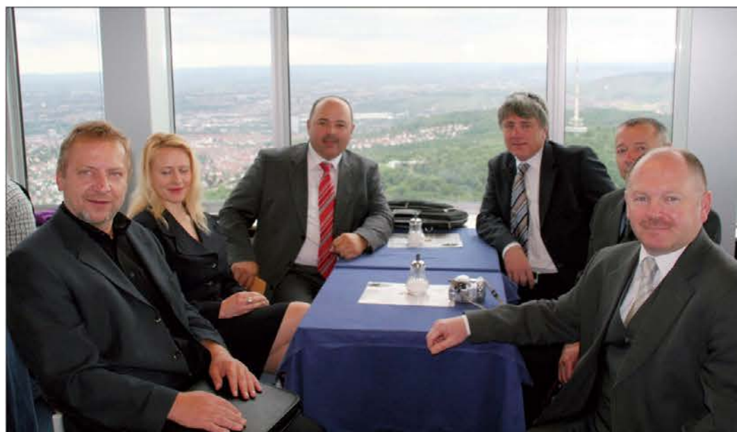
Parlamentarna komisija na visokem obisku v Stuttgartu 150 metrov visoko na televizijskem stolpu