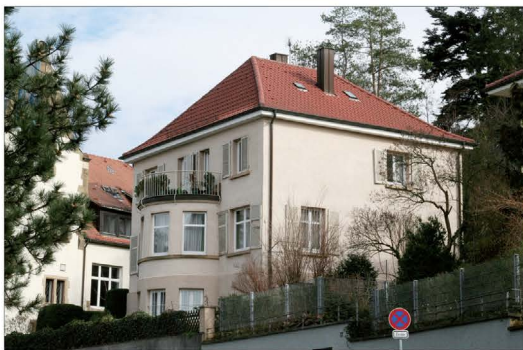
Slovenski dom v Stuttgartu na Staffenbergstr.