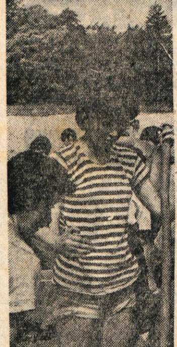
Zamisljena? Morda za hip ali dva sredi dela; čez nekaj let bo učiteljica, pa bo pripovedovala otrokom, kako je pomagala v mladinski brigadi graditi domovini njen lepši obraz...