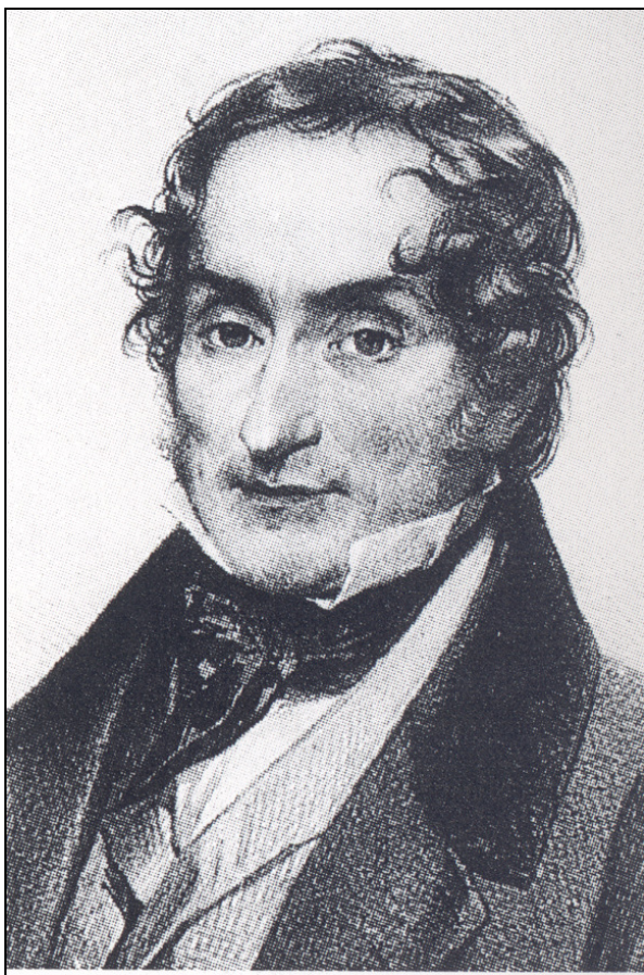
Charles Nodier (1780–1844).

vse močnejšo odmevnostjo pohoda v Rusijo 48 se je zdelo, da se je politična vloga Télégrapha postopoma povečala. Nodier je moral torej prikriti umik Napoleonove vojske in napredovanje koalicije. Te Nodierove politične vloge pa vseeno ne gre jemati preveč dobesedno, kajti storil ni drugega, kot da je s svojim peresom sledil politiki Fouchéja, ki so ga oblasti imenovala za glavnega guvernerja julija 1813.