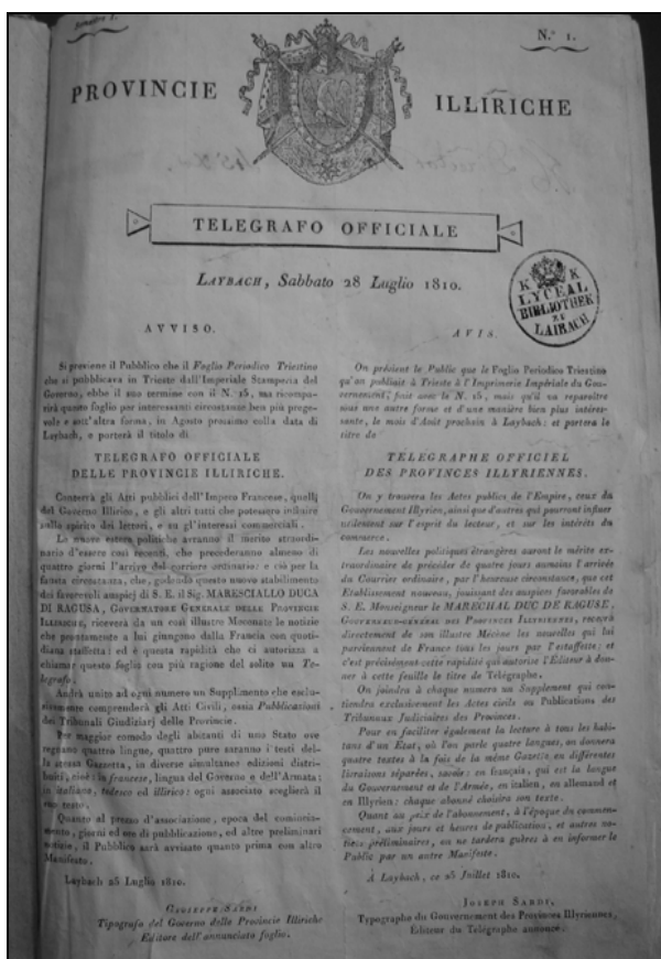
Télégraphe Officiel, Oglas, 28. julij 1810.

priča o želji oblasti, da bi dosegle čim širšo javnost in segle preko jezikovnih ovir. Oglas je podrobno opisoval vsebino prihajajočega lista. Tako je jasno povedano, da se " Télégraphe " obvezuje, da bo obveščal javnost o " javnih zadevah Francoskega cesarstva in o zadevah Ilirske vlade ", 5 pa tudi o tujih političnih dogodkih ". Vodstvo Télégrapha je svojim bodočim bralcem prav tako obljubljalo izdajo priloge, ki bo namenjena zakonskim odlokom in " lokalnim oglasom, (...) ki bi jih kdo želel objaviti ". 6 Na voljo so bile tudi praktične informacije o izhajanju (vsako sredo in soboto opoldne) in o višini naročnine, ki so jo določili na dvajset frankov letno, kar je bil precej velik znesek glede na lokalne ekonomske razmere. Zdi se, da ta drugi prospekt zagovarja dejstvo, da je bil na začetku septembra proces redakcije časopisa že krepko v teku. 7 To domnevo potrjujejo tudi Benincasove izjave, češ da so zgolj tehnične ovire preprečile izid prve številke Télégrapha , ki je bila tedaj očitno že spisana. Precej verjetno je, da se začetna predvidevanja niso uresničila predvsem zavoljo Sardijske zanikrnosti. V svoji tiskarni