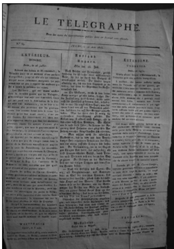
Trijezična izdaja Télégrapha 26. avgusta 1813.

Dejansko so tri številke Télégrapha od 26. avgusta do 5. septembra 1813 izšle v treh stolpcih, od katerih je bil eden v francoščini, drugi v nemščini, tretji pa v italijanščini, drug poleg drugega. Najverjetneje je to edini znani primer v obdobju Napoleona, da je kakšen časopis izšel v treh jezikih in to na eni sami strani. 79 Po Nodierovem begu v Trst je Télégraphe izhajal le še v francoščini in v italijanščini, v dveh stolpcih. Ta način izdaj je moč razložiti z izjemnimi okoliščinami v Ilirskih provincah konec avgusta in v septembru 1813, ki jih je zaznamoval postopen umik francoske administracije in vedno težje okoliščine za izdajanje časopisa, kljub povečani potrebi po propagandi za ohranjanje zadnjih iluzij o skorajšnji zmagi Napoleonovih čet.