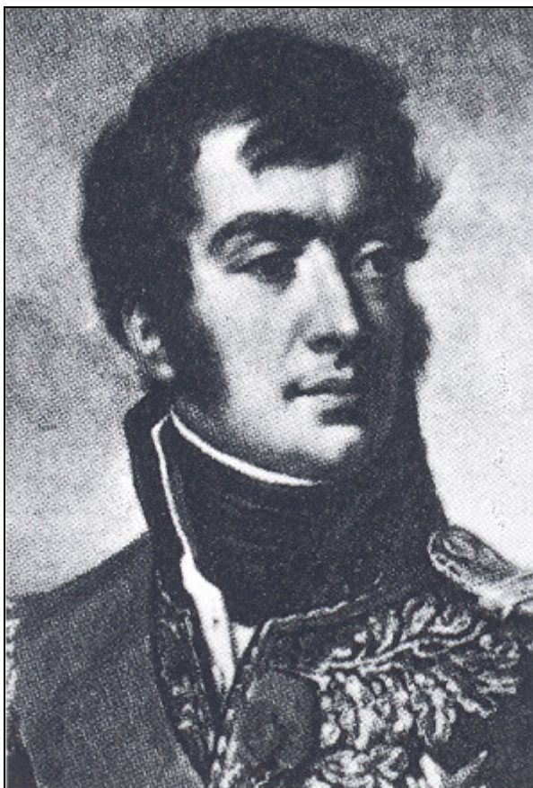
Auguste Frédéric Louis Viesse de Marmont (1774–1852).

Francoska oblast v Dalmaciji je že prej omogočila izdajanje dvojezičnega lista pod pokrovitelj-