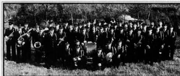
Godbeno društvo "Nabrežina" 25. aprila letos

Od petka dalje bo v Nabrežini zelo slovesno, saj proslavlja tamkajšnja godba 100-letnico delovanja. V počastitev temu častitljivemu jubileju in v dokaz vedno boljšega medsebojnega sodelovanja jim je sorodno domače športno društvo Sokol pripravilo praznik na odprtem igrišču v Nabrežini, kjer bo ob tej priložnosti tudi tradicionalna pokašnja domačih vin. Dobre glasbe, pristne kapljice, domačega prigrizka in veselega razpoloženja res ne bo manjkalo, zato vsi toplo vabljeni v Nabrežino! - ED