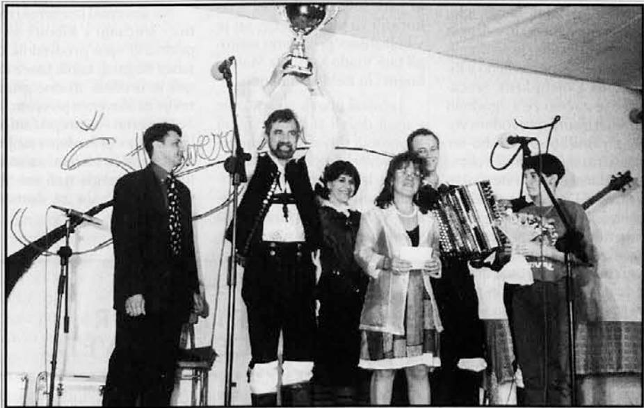
Laufarji, najboljši ansambel letošnjega števerjanskega festivala

V nedeljo zvečer je padel zastor na 27. festival narodno-zabavne glasbe Števerjan 1997. Zaključilo se je tridnevno tekmovanje prijavljenih skupin, povezano s praznovanjem.