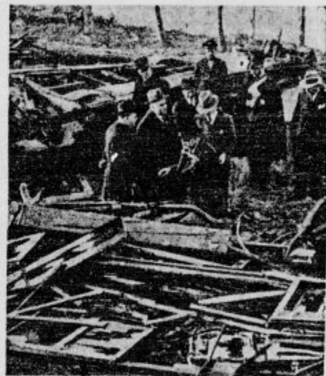
Velika železniška nesreča se je pripetila nedavno na železnici, ki vozi na ognjenik Vezuv. En voz je ekočil s tira in se zakotalil v globočino. Pod razvalinami so dobili 7 mrtličev in 9 ranjencev. Sliki kažejo razvaline voza na kraju nesreče in železnico, ki vozi na goro.

Nova služkinja. »Če hočete, da Vam ostanejo jajca dalj časa sveža, jih morate ehranjevati na hladnem prostoru.« — Že razumem, ali kako naj to dopovem kokošim?.