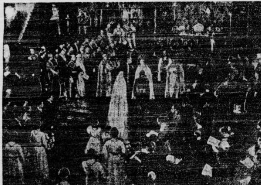
Westminsterska opatija, v kateri je bila poroka.