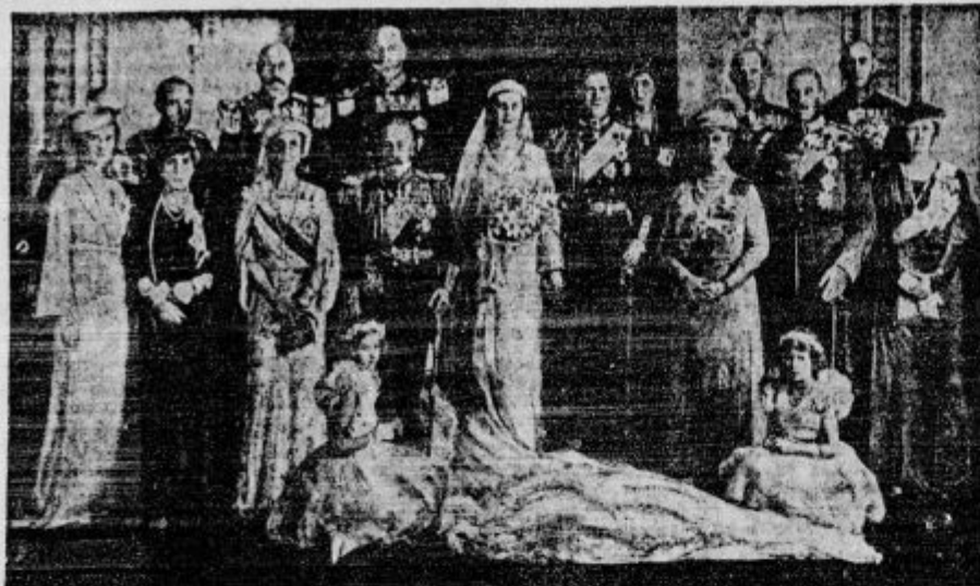
Vojvoda in vojvodinja kealska — novoporočena dvojica — prvi gosti anglički in jugoslovanski — žena, rojena grška princezinja Marina. To je uradna slika mlade dvojice, posneta od angleškega dvornega fotografa v prestolni dvorani palače Buckingham.