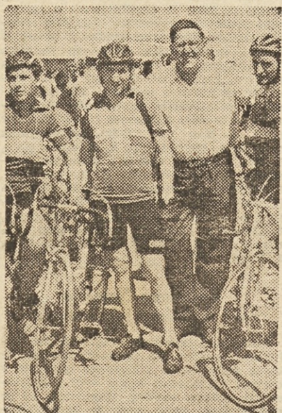
Dva slovenska kolesarja, ki sta se udeležila nedavnih dirk po Bolgariji