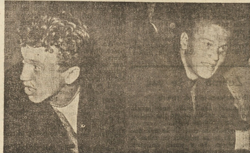
Pero in Hors — tako pravijo Kralju in Dermastji — v zadnjem času vse pogosteje uspešno zastopata barve Olimpije.