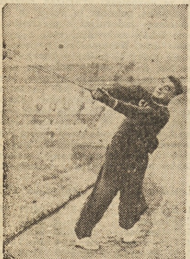
Svetovni rekorder Krivonosov (SZ)

V drugem kolu so sprejeli v goste Lokomotivo. Zaradi razmočenega igrišča igralci Olimpije niso mogli pokazati iste igre kot proti Proleterju, toda tudi 20 košev razlike v njeno korist je dovolj. Če bodo (Nadaljevanje na 5. strani)