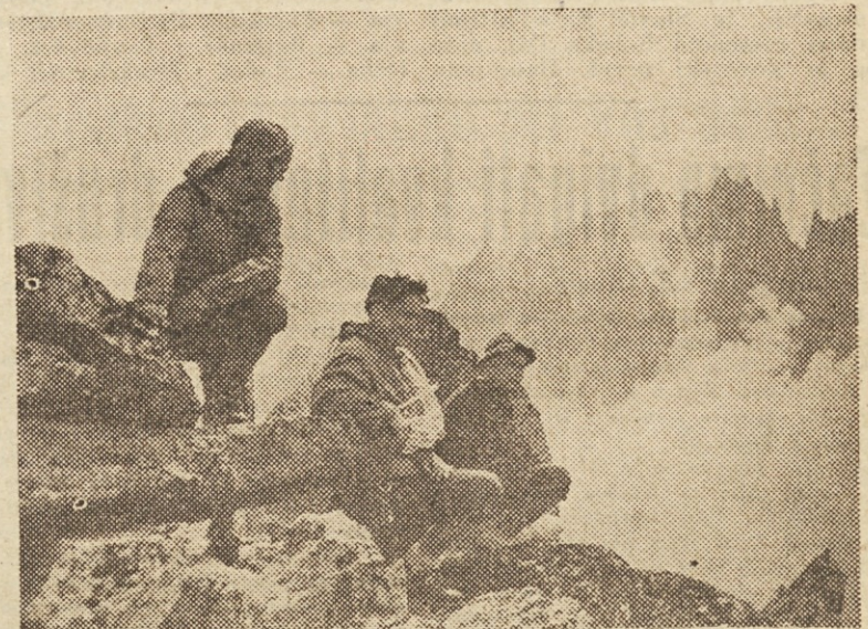
Naši alpinisti so prejšnji mesec v Franciji izvršili vrsto pomembnih vzponov (beri članek tov. Igorja Levstka na 3. strani)

Kamnik, 4. sept. To je bila tipična prvenstvena tekma in borba za točke. Obe moštvi sta pokazali precej slabo kvaliteto, pač pa je bila borbenost toliko večja. Zmaga Kamničanov je povsem zaslužena.