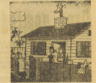
»Mož, ugani, kaj ti je prinesel stric Janez iz Afrike!«

Vodoravno: 1. kupiti, 7. spo- doben, 14. akumulator, 16. zora, 17. rame, 18. živa, 19. otajam, 21. Ana, 22. vrana; 24. ara, o. 25. Ka, 26. krilatice, 27. B(re)č T(omo), o. 29. OLO, 30. arara, 31. sla, 32. robače, 35. fks, 36. ulov, 37. ujet, 38. pinakoteka, 41. medicina, 42. Akadem,