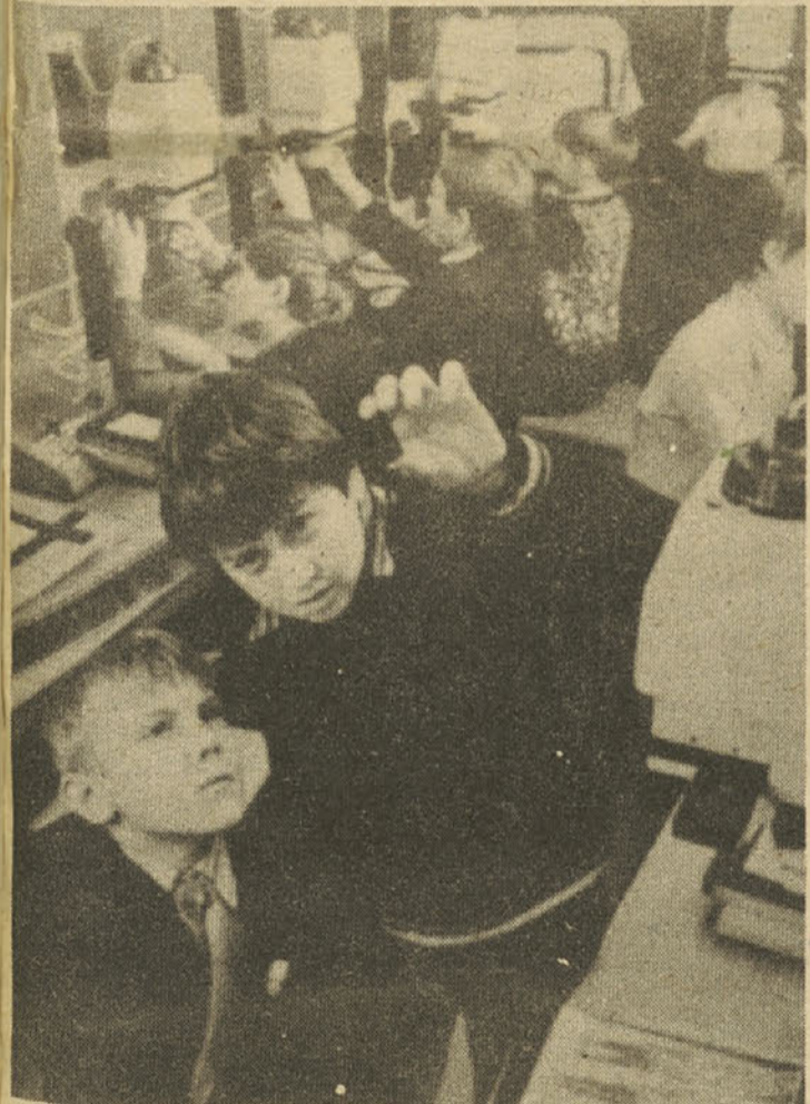
Pri fotosekciji sami odkrivajo svet

Za modernizacijo pouka matematike v osnovni šoli so v š. l. 1975/76 do 1978/79 nastali novi slovenski učbeniki za matematiko od 5. do 8. razreda, v š. l. 1977/78 do 1980/81 pa še učbeniki na razredni stopnji pouka. Ves čas je potekala tudi sprememba uresničevanja učnega načrta in učbenikov, ki je bila izhodišče pri oblikovanju sedanjega predloga novega učnega načrta za javno razpravo. Po novem predlogu naj bi razbremenili učni načrt, ki naj omogoča tudi zadostno utrjevanje obravnavane snovi. K tej razbremenitvi bo