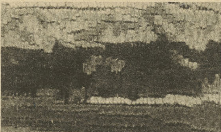
Gobelin — čestitka za dan žensk, ki so jo izdelali učenci Zavoda za usposabljanje Janez Levec