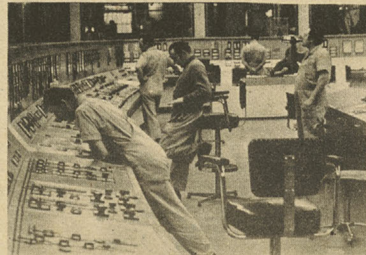
Thomas Höpker, Zahodna Nemčija — s Svetovne razstave fotografije

Ludoteka je nedvomno vir igralne kulture, zvišuje zavest za dobri uporabi prostega časa, vendar je ustanovitev take ustkladne nove zahtevno delo. Igrače se drugače uporabne kakor knjige, zato je zlasti od otrok težko zahtevati, da bi jih zmeraj vračali, nespomenjenem stanju. Strošnice za ludoteko bi bili dokaj veliki, čeprav bi se verjetno v vzgoji tega prosti čas obrestovali. Zamisel je zanimiva, zato bi se kazalo o njej