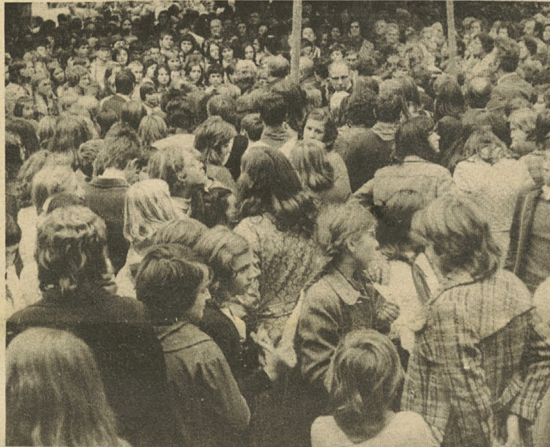
Mladi: veliko načrtov in veliko želja

Tudi ti roki veljajo prav tako za kandidate, ki se nameravajo izobraževati ob delu ali iz dela.