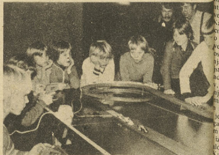
V ludoteki bi si otroci lahko izposodili vse: tudi železnico. Ludoteka lahko dobra vez med industrijo igračk in igralci. Marsikom se izposoja igrača tako priljubi, da jo želi obdržati. To pa se lahko zgodi, plača zanjo odkupnino. Ne pozabimo, da gre za kakovostno igračo za razvoj igralne kulture!

ugotavljali, da pretirana kopica igračk otroka moti pri igri, ker ga odločati niti dodobra vživljati v igro, pa venomer nekaj menjuje. Igrača je igralčevo orodje za dejavnost, zato ga potrebuje le malo. Pomembnejše je, da ima kakovostno igralno orodje, zato ni vseeno, kaj dobi otrok v roke. Ludoteka naj bi bila skladišče različnejših igralnih pripo-