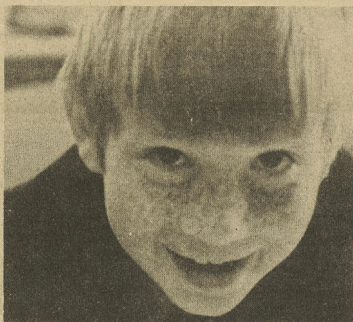
Najraje imam pravljice!

Glede bralnih značk je bilo veliko nejasnega. Učenci so bili razdeljeni po starostnih stopnjah. Za značko so brali vsako drugo leto, vmes pa so prejeli priznanje ali knjigo. Vsaka šola si je torej krojila pravilnik po svoje. Dogajalo se je tudi, da so posamezni učenci, ki so prebrali več, kot predpisuje tekmovanje za bralno značko, prejeli poleg značke še posebne knjižne nagrade. To je neke vrste razvrstitev bralne značke in ni vzgojno do tistih, ki so tudi izpolnili pogoje in prejeli samo značko. Nagrada za branje je značka! Tisti, ki so pri učenju