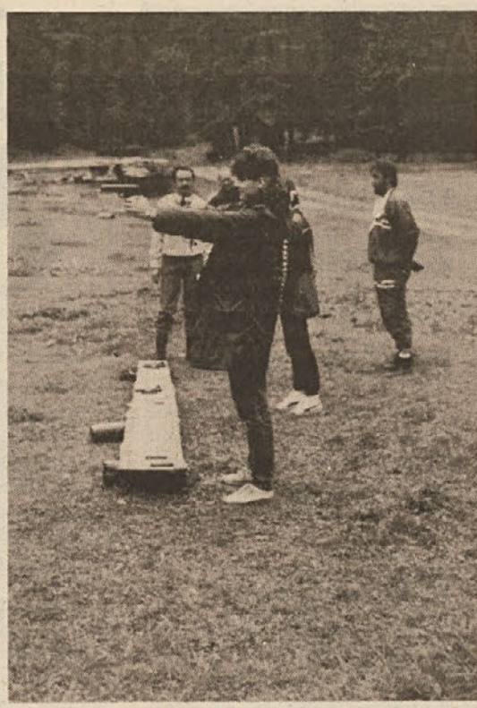
Pri streljanju so se udeleženci obrambnega dneva Merx najslabše izkazali. Na posnetku lahko vidite, kako so svoje roke umirjali pred streljanjem člani ekipe Mlinsko predelovalne industrije.