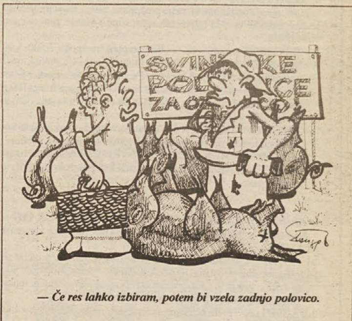
— Če res lahko izbiram, potem bi vzela zadnjo polovico.

Po svetu so zaradi velikega zanimanja povpraševanja po specifičnih kmetijskih računalniških programih nastala podjetja, ki se ukvarjajo zgolj z razvojem in prodajo tovrstnih programov. Takšnih pa pri nas še ni in na Republiškem centru za pospeševanje kmetijstva menimo, da lahko v prihodnje pričakujemo večje zanimanje kmetov za računalništvo. Pospeševalna služba bo morala tudi na tem področju pomagati. Da bi se pravočasno pripravila na zahteve, je treba pričeti z delom že zdaj.