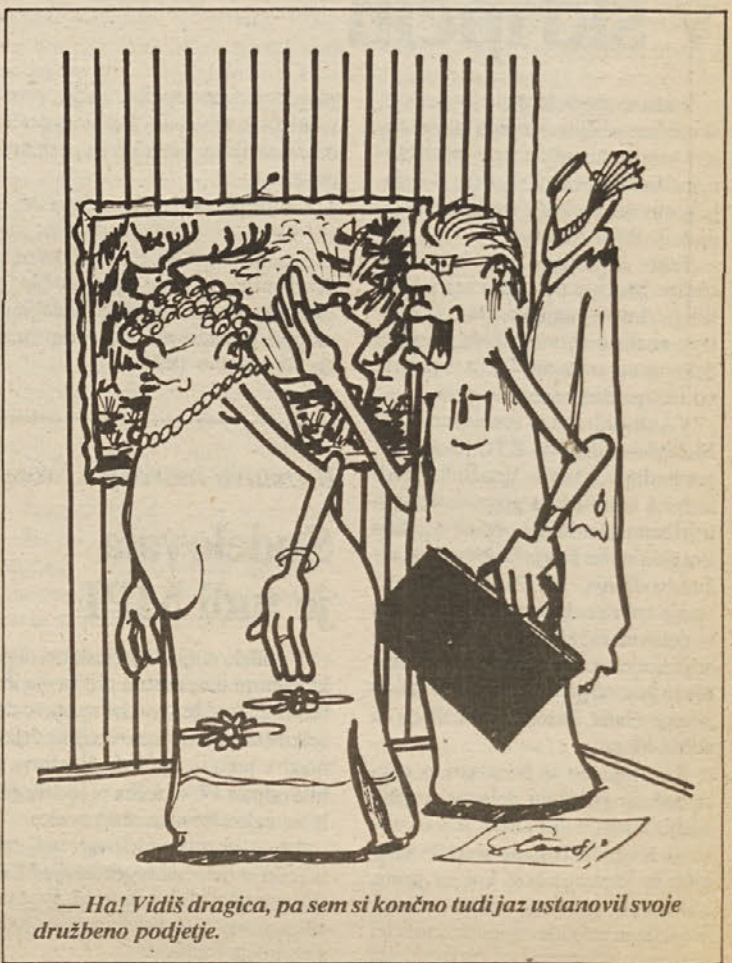
— Ha! Vidiš dragica, pa sem si končno tudi jaz ustanovil svoje družbeno podjetje.

Če sem uspel vsaj malo na novo vzbuditi vašo razmišljanja ali izostriti vašo najmanjšo misel v smeri kaj nam je početi in zakaj — trud ni bil zaman!