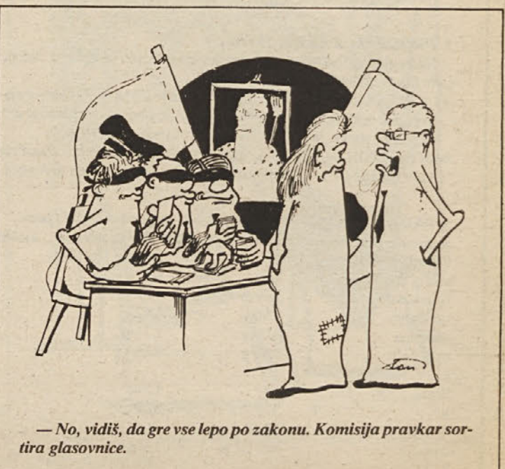
— No, vidiš, da gre vse lepo po zakonu. Komisija pravkar sortira glasovnice.