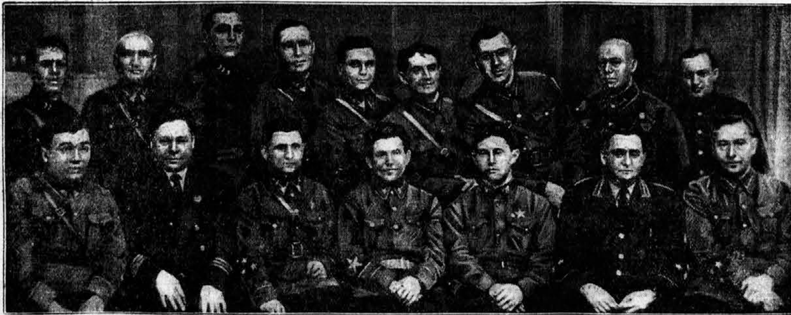
Vsa važna mesta v Sovjetski Rusiji so zavzeli židje

Ljubljana. Življenje lahko imenuješ boj proti svojim vidnim in nevidnim sovražnikom. Smisel življenja pa ravno zmago nad samim seboj — nad svojimi slabostmi (nevidnimi sovražniki) in pa zmago proti tistim, ki ti nočejo nuditi eksistence, tem