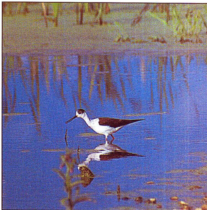
Slika 4: Polojnik Himantopus himantopus, Hraše, 19. 5. 1996

Sivka Aythya ferina - Za to vrsto rase so samo trije podatki: 26.3. eden (1), 27.3.1996 dva (2) in 21.9.1997 trije (3) osebki.