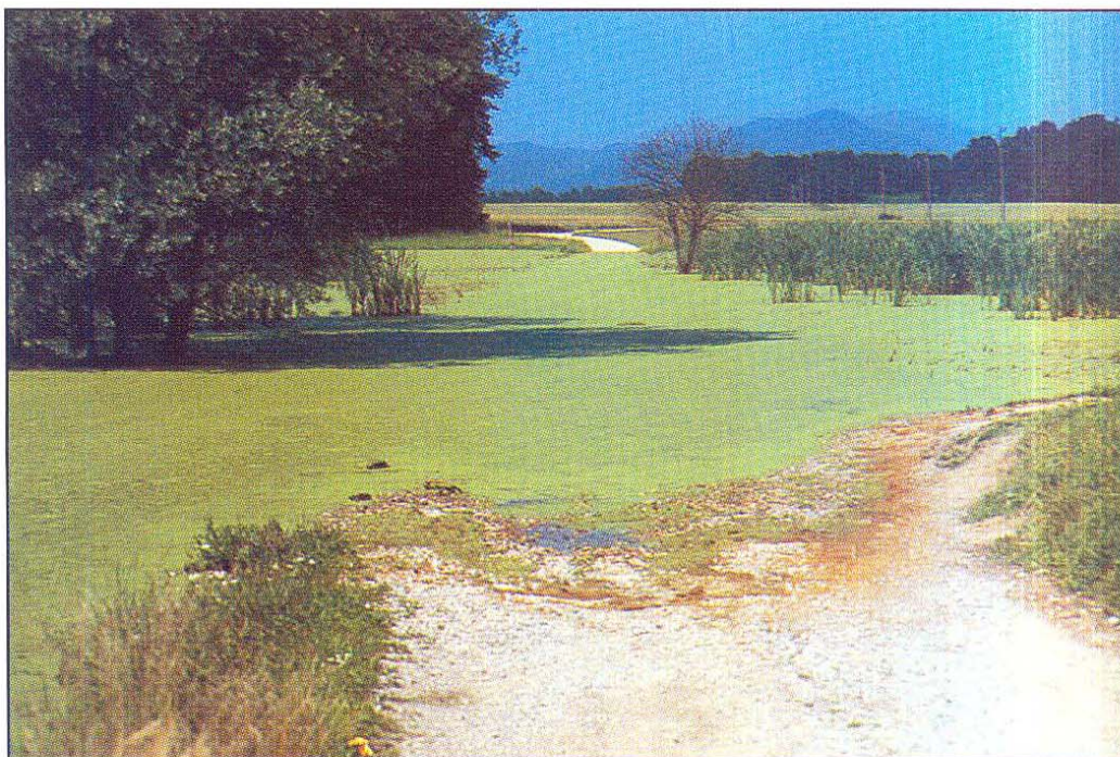
Fig. 5: As soon as the two separate water bodies merged, the local road was submerged; spring 1996 (I. Geister).

Grahasta tukalica Porzana porzana - Opazovana je bila vedno le v drugi polovici leta (od julija do novembra), v letu 1995 enkrat, v letu 1996 trikrat po en osebek.