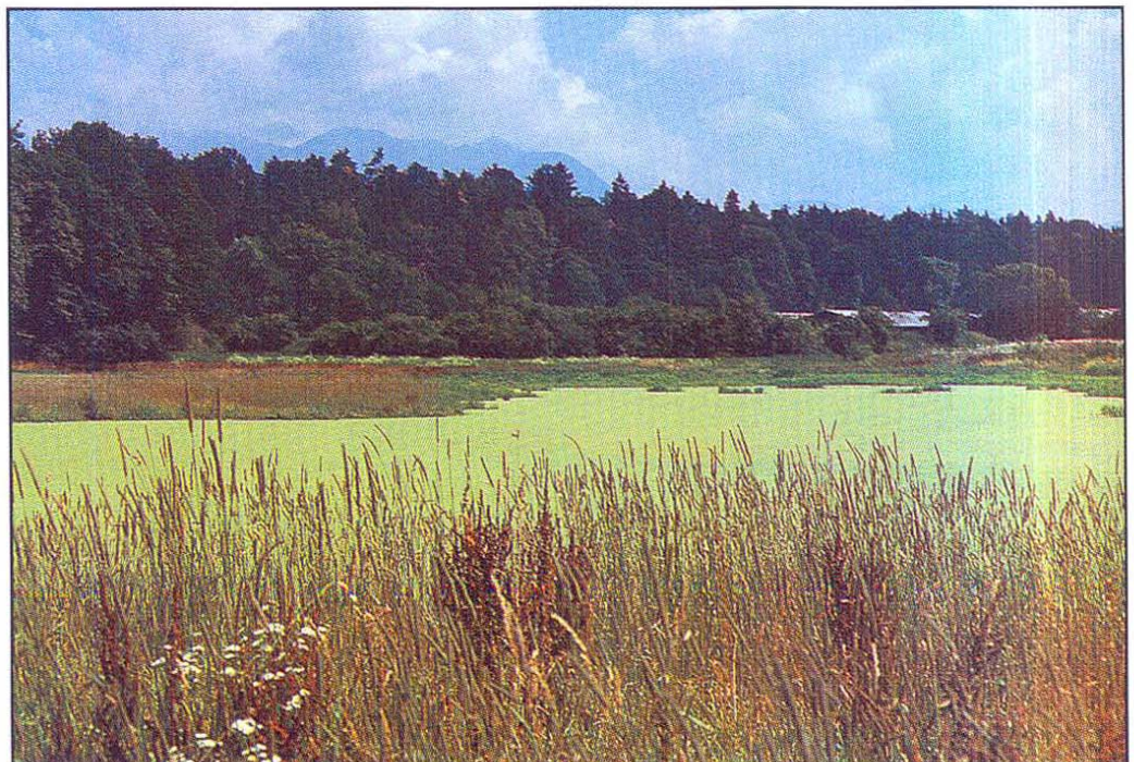
Fig. 3: Western Hraše pool in spring 1996 (I. Geister)

Slika 3: Zahodna Hraška mlaka spomladi 1996 (I. Geister)