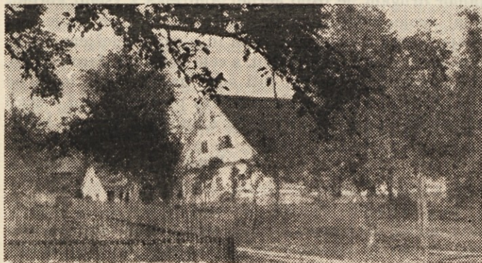
Andrejkov dom v Dolenjah. Pogled z občinske ceste.