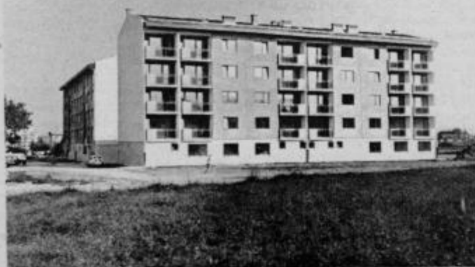
Nova stanovanja za delavce v kolektivu IMPOL Slov. Bistrica.