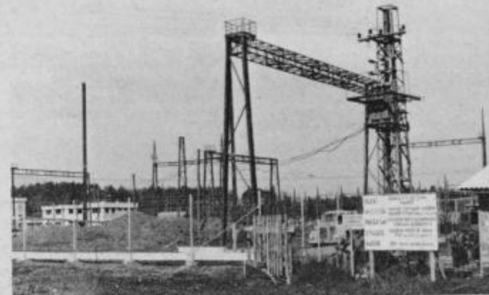
Stikalnice nove transformatorske postaje Maribor v Dogašah, katere izvajalec gradbenih del je TOZD „Drava Ptuj.“