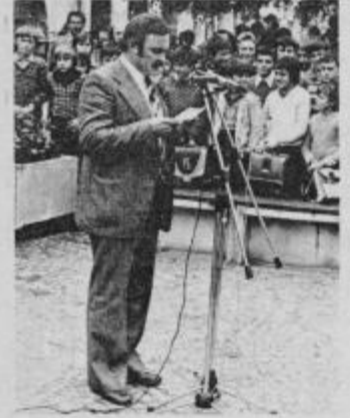
Pihalna godba „Ilirci“ iz Krapine ob prihodu s Karavano v Ptuj.

Občina Krapina je bila letos organizator že 15. tradicionalnega srečanja pobratenih slovenskih in hrvaških občin. Karavana prijateljstva, tako se je imenovala letošnja pot, je z avtomobili obiskala v Sloveniji najprej Središče ob Dravi.