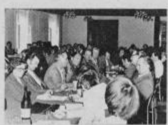
Delegati na konferenci sindikatov v narodnem domu v Ptuju

minulega dela in podobno. Če je javna razprava o osnutku zakona o združenem delu na videz zadovoljiva pa nas nikakor ne sme zadovoljevati vsebina same razprave, ki je imela v veliki večini