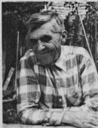
Glavni vzrok nenadnim in nerazumevajočim vremenskim spremembam pripisujem luninim spremembam, ki so vse v poznem nočnem času.

Pravo pomladansko vreme se bo začelo šele v sredini aprila. Poletje bo precej deževno. Bo mnogo grmenja, leto pa bo prav ugodno za žito, oljarice in za grozdje. Jesen bo mokra. Predvidevajo se velike poplave, ki bodo povzročile tudi veliko škodo in ogrožale zdravje ljudi in živine“ — OM