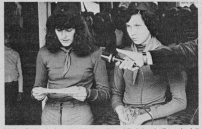
V Središču ob Dravi so Karavani izrekli dobrodošlico pionirji osnovne šole

Občina Krapina je bila letos organizator že 15. tradicionalnega srečanja pobratenih slovenskih in hrvaških občin. Karavana prijateljstva, tako se je imenovala letošnja pot, je z avtomobili obiskala v Sloveniji najprej Središče ob Dravi.