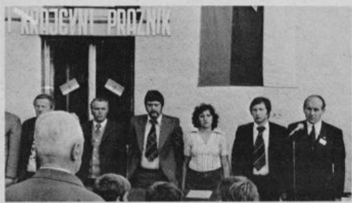
Delovno predsedstvo na svečani seji.