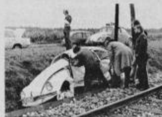
Med stisnjeno pločevino je ugasnilo človeško življenje.

Zaradi neupoštevanja prometnih znakov, „andrejevega križa“ in znaka STOP je prišlo 18. septembra ob 6.10 na železniškem prelazu v Hajdini do hude prometne nesreče, ki je terjala življenje Franca Zupaniča iz Draženc 42. Zupanič je zapeljal čez prelatz, kjer ga je zadel vlak in ga potiskal po progi še 264 metrov; voznik je na kraju nesreče podlegel poškodbam.