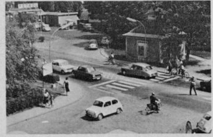
Eden od nevarnih prehodov s Trga svobode v mestni park

kor vemo, da so se prometne razmere od lanskega leta do letošnjega spremenile in vedno je gostejši promet. Prometa je na glavnih cestah precej več in zato je večja možnost za prometne nezgode neprevidnih otrok.