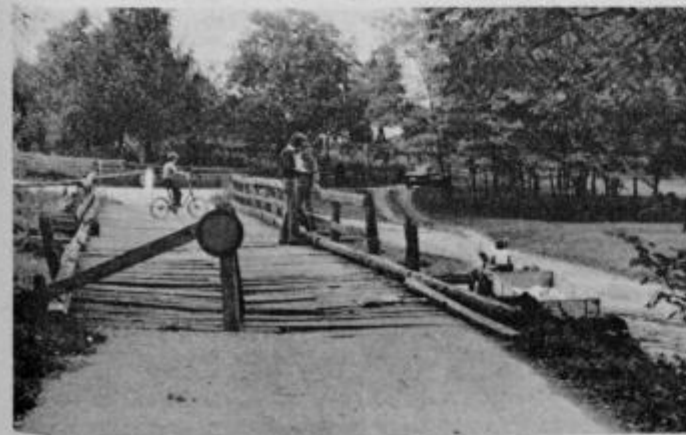
Most je povsem dotrajal