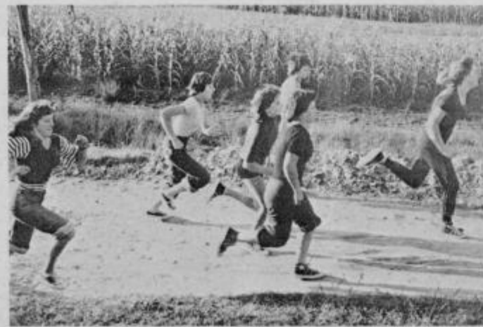
Največ vztrajnosti in pravega športnega duha so morale pokazati ženske v krosu čez drn in strn na 800 m