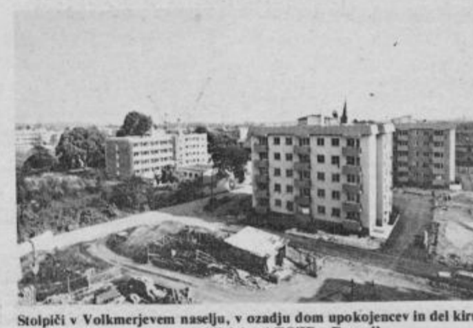
Stolpiči v Volkmerjevem naselju, v ozadju dom upokoencev in del kirurškega oddelka, vse to so zgradili delavci TOZD „Drava“.