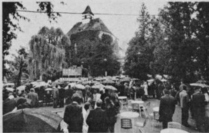
Delavcem KK Ptuj je na proslavi na Borlu nagajal dež.