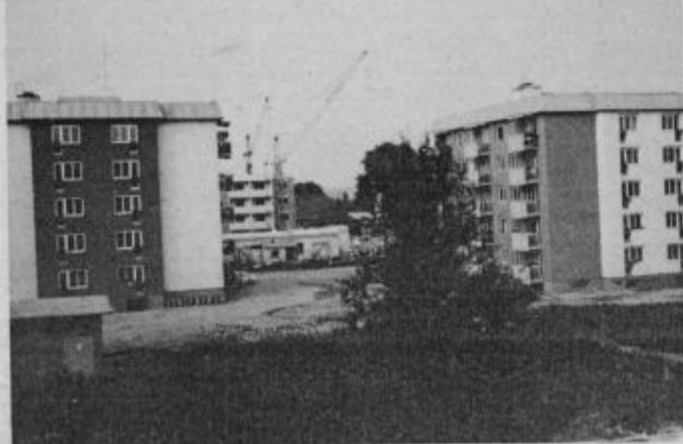
Motiv iz Panonske ulice, kjer je TOZD „Drava“ zgradila v razmeroma kratkem času več nujno potrebnih stanovanj.