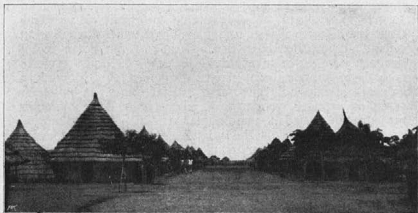
Cesta v misijonski vasi v Unyamwezi.