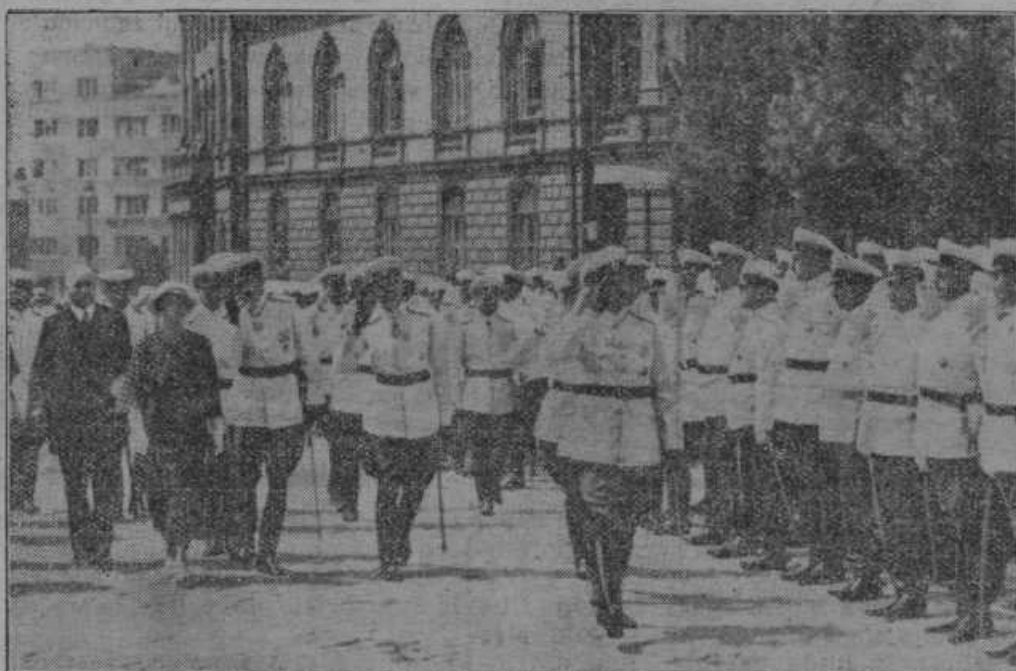
Praznik sv. Cirila je na Bolgarskem narodni praznik. Kralj s kraljico pri oficirski paradi.

aparatu, ki je v kuhinji, kjer so bili vsi zbrani, bi bil udar strele zahteval človeške žrtve. Popokale so na šolskem poslopju vse šipe in pregorele so električne žarnice.