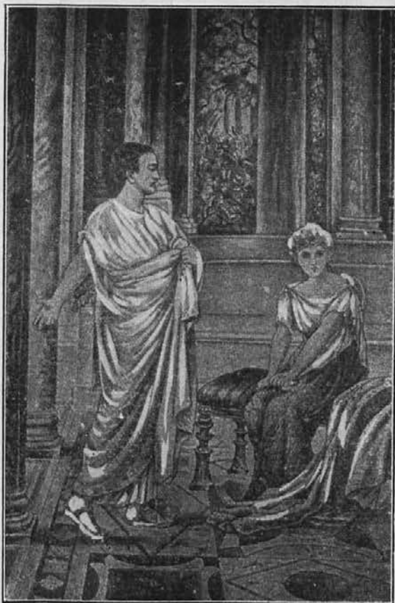
Lupercij in Eukratida.