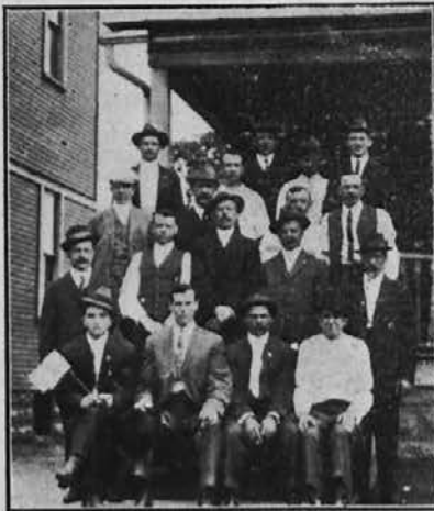
Pripravljalni odbor za slov. cerkev v Barberton, Ohio.

Barberton, O. Rojaki v Barbertonu se zelo trudijo in zanimajo, da bi si postavili svojo lastno cerkev, katera je res potrebna in da bi dobili svojega slovenskega duhovnika. Ko bi se kateri slovenski duhovnik zavzel za nje, bi storil veliko dobro delo.