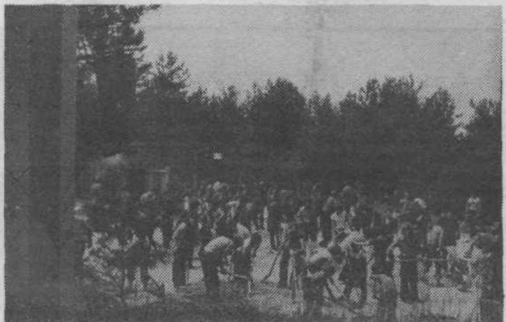
Ko smo začeli