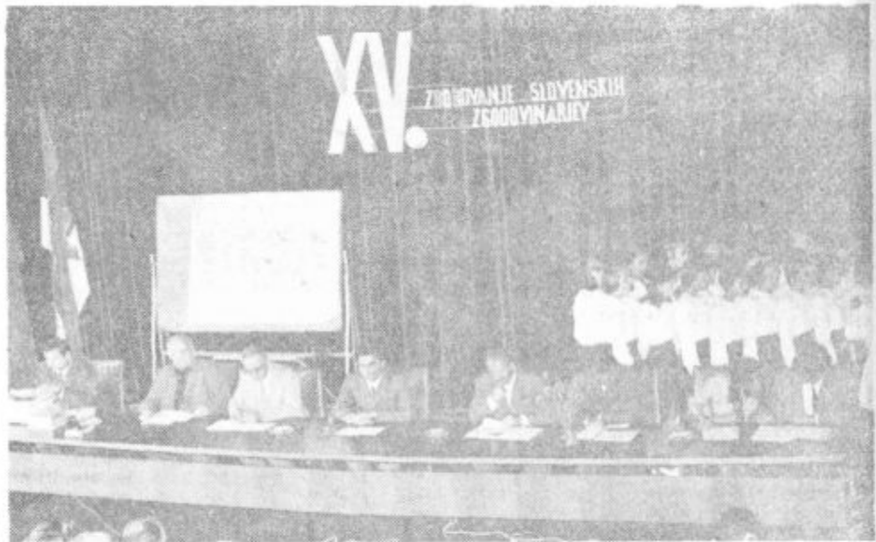
Ob otvoritvi zborovanja slovenskih zgodovinarjev v Velenju