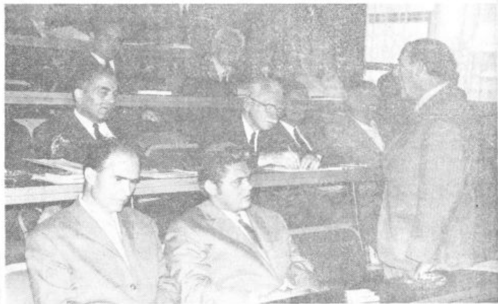
Podpredsednik velenjske Občinske skupščine je pozdravil zbrane zgodovinarje