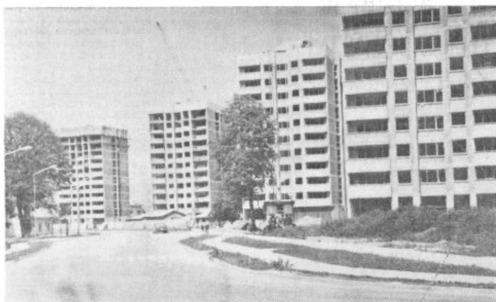
Stolpiči ob Partizanski cesti, ki jih gradi Vegrad

Dosežki letošnjega leta kažejo, da je Vegrad perspektivna delovna organizacija, ki se vse bolj vključuje v razvoj velenjske občine.