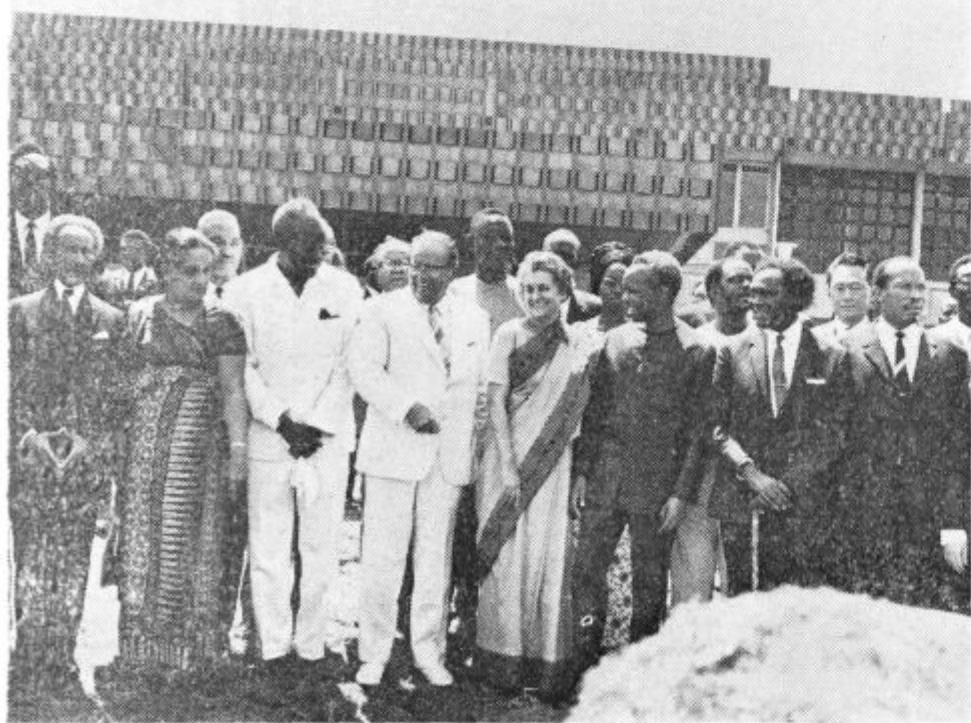
KONČANA JE KONFERENCA V LUSAKI — Borba za mir, za koeksistenco in neodvisnost so ideje, ki so v Lusaki zbrale državnike Azije, Afrike, Evrope in Južne Amerike. Na konferenci je aktivno sodeloval tudi predsednik SFRJ Josip Broz Tito, ki je vodil prvo zasedanje na konferenci v Lusaki. — Na fotografiji so pred palačo Mulumbuši voditelji vseh delegacij.

Srečne dobitnike prosimo, da dobitke dvignejo pri trgovskem podjetju »ERA«, poslovna enota GORENJE, Koroška cesta 51 v Velenju s predložitvijo nakupnega računa in osebne izkaznice, najpozneje do 30. septembra 1970.