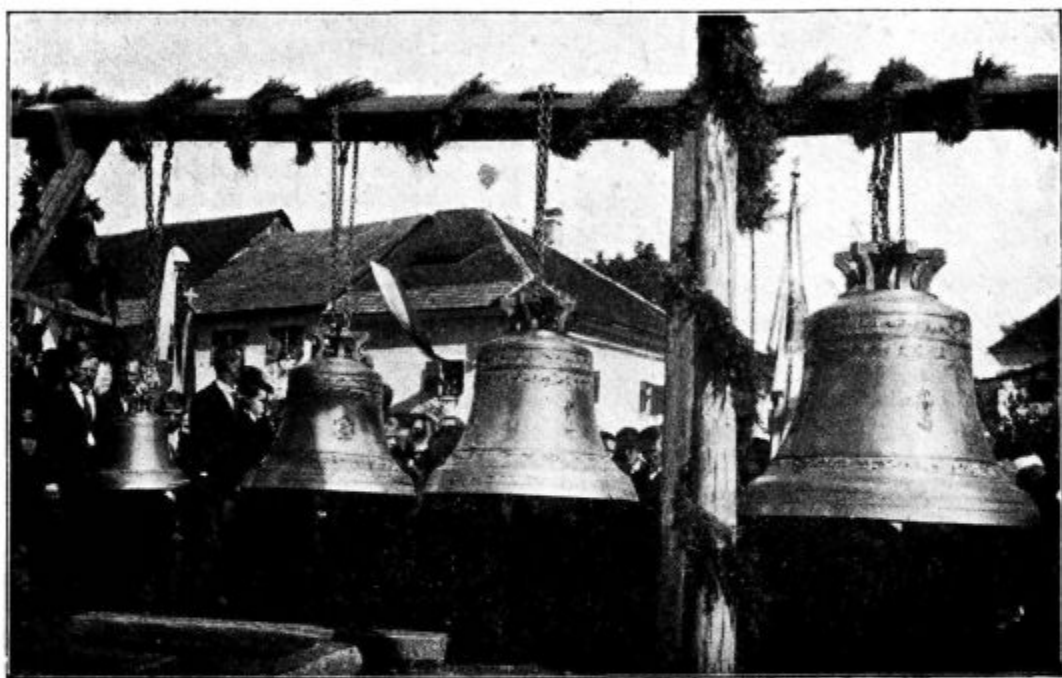
Novi zvonovi v Žužemberku.

zadovoljna? »Da,« odgovori mati, »to je bil krstni dar njegovega botra; prav res me veseli, da je dečko tako napravil, nič mi ni rekel; prav, čisto prav tako,« in obraz ji je zažarel v ljubezni in srečnem zadovoljstvu. Rada bi mu bila izrekla še osebno zahvalo, a ni ga več bilo doma; odšel je že in vstopil k misijonarjem; prej pa je izročil najdražje, kar je imel za Evharističnega Kralja. M.