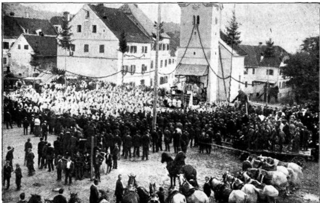
Posvečevanje zvonov v Žužemberku (pred podružnico na trgu).

genco. Tu je velika vrzel, pomanjkljivost, ki jo je čimprej odpraviti. Inteligenci se mora dati možnost, da more tudi tej veliki dušni potrebi zadostiti — pa naj si bo z zgradbo posebnega doma za duhovne vaje ali kako drugače. Človek, ki ga sedanjí družabni red, boj za vsakdanji kruh, kar sili v materializem, potrebuje, da se od časa odtrga od sveta in materialnih skrbi in se pogovori v samoti s svojim Stvarnikom. Zdi se mi, da bi ta stvar pomenila nepregledno velik napredek za versko življenje naše inteligence in posredno tudi celega naroda.