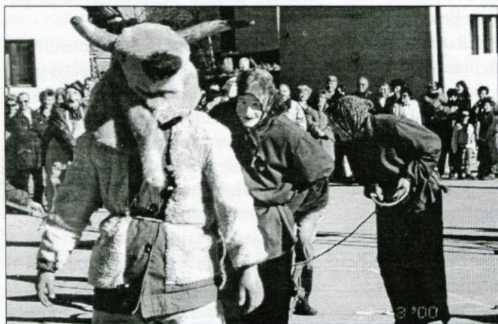
Vol in Mice