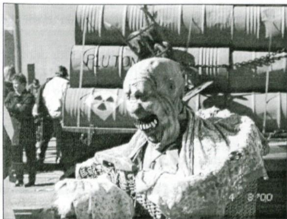
Vedno aktualni Češčani – letos z uparjalnikom