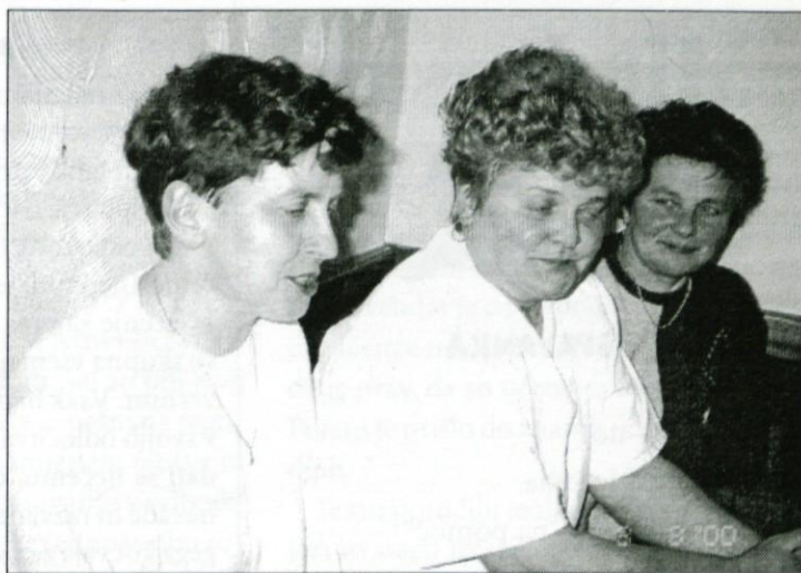
Na fotografijah so članice DPŽ, med njimi jih je več iz Strug