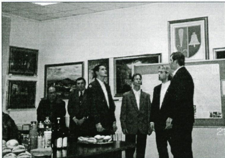
Na slovesnosti je nastopil kvartet Beati