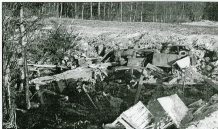
Še vedno se pojavljajo divja odlagališča