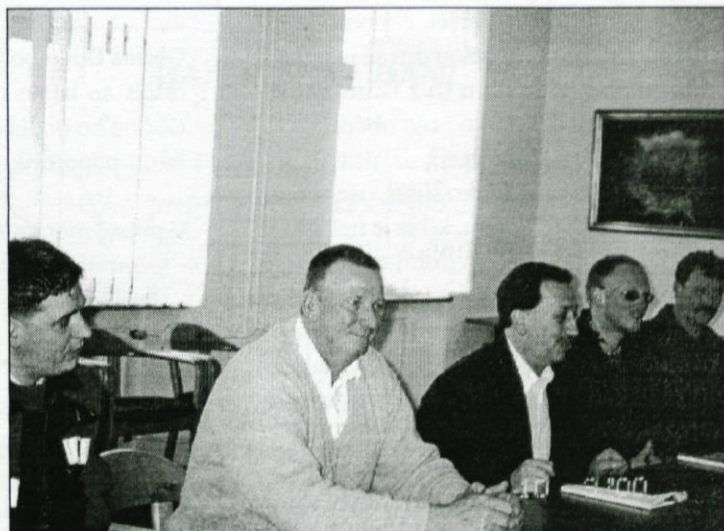
Predstavniki GZ Dobropolje