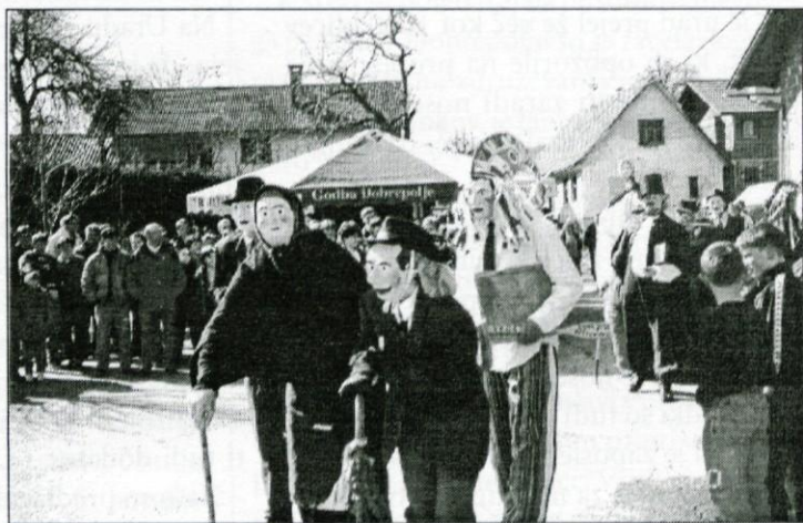
Ta star in ta stara