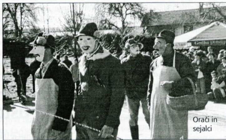
Orači in sejalcji