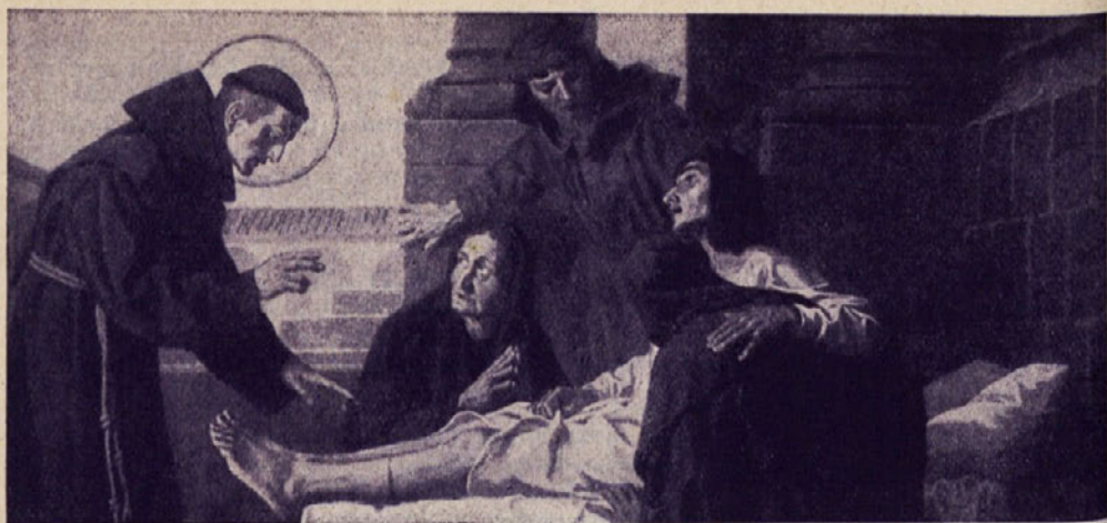
Cerkev v Mühlhausenu — Sv. Anton ozdravi odsekano nogo