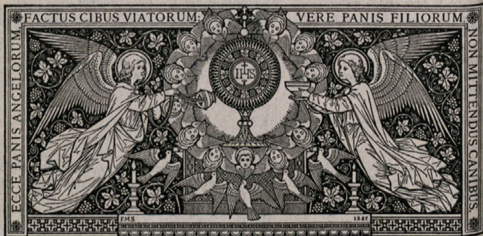
Hvaljen bodi Jezus v najsvetejšem oltarnem zakramentu

Jezus na cesti, to je priznanje socialnega kraljestva Kristusovega. Cesta je simbol tega, kar se na njej odigrava: promet, trgovina, zabava. To je delo na cesti. Moderna cesta je zvesto ogledalo modernega duha in zato posvetna, brez vere, brez konfesije. Nič krščanskega ob njej in nič na njej, nič izrazito katoliškega! Izzveti so cerkveni zvoniki, ki kot klicarji večnosti gledajo nad strehami. Toda cerkveni zvonik ne vlada več javnega življenja. Cerkveni zvonik je postal puščavnik, cesta pa gre mimo njega svoja pota. Vera ne odloča in ne prešinja več človeškega dela in prizadevanja. Ni več duša ljudstva in merilo ljudskega življenja. Kristus je Kralj, ima še prestol, ali dežele nima več. Živimo v dobi laicizma, živimo v svetu, ki je brez Boga in Bogu tuj.