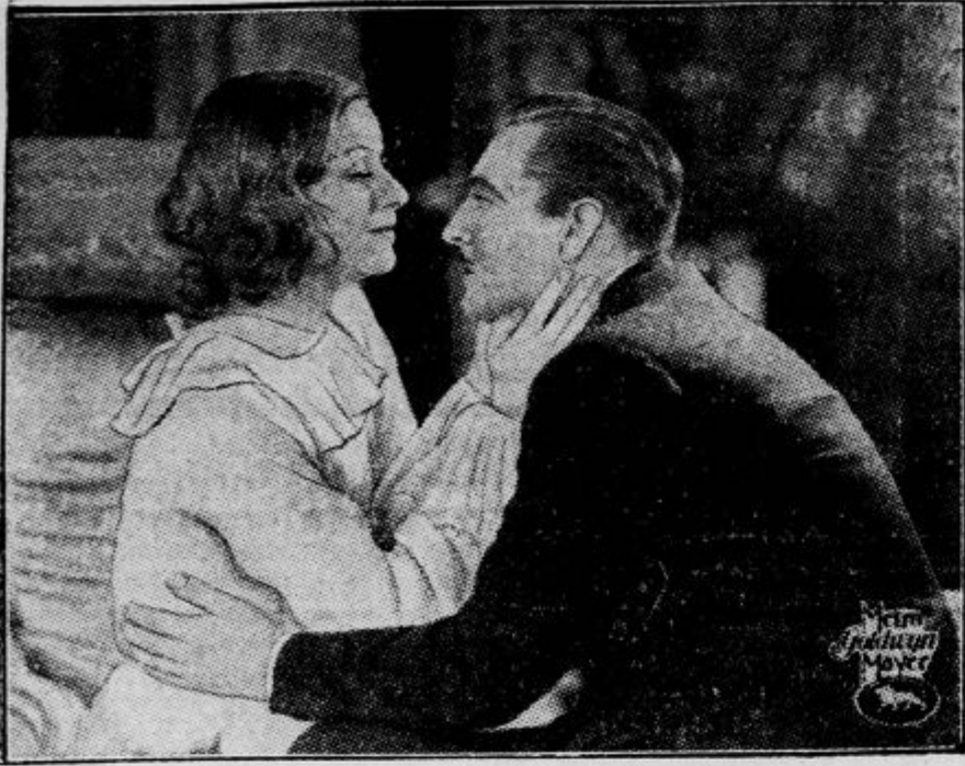
Prizor z Greto Garbo v filmu »Grandhotel«