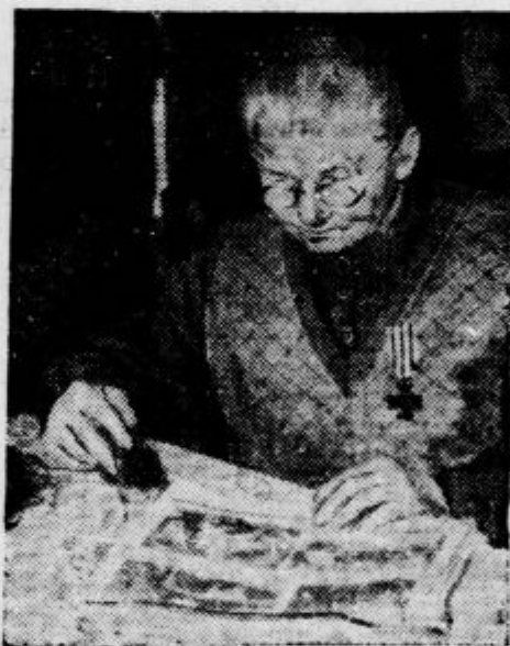
Hauptmannova mati piše prošnjo ameriškiemu prezidentu in ga prosi, naj pomilosti njeneja na smrt obsojenega sina