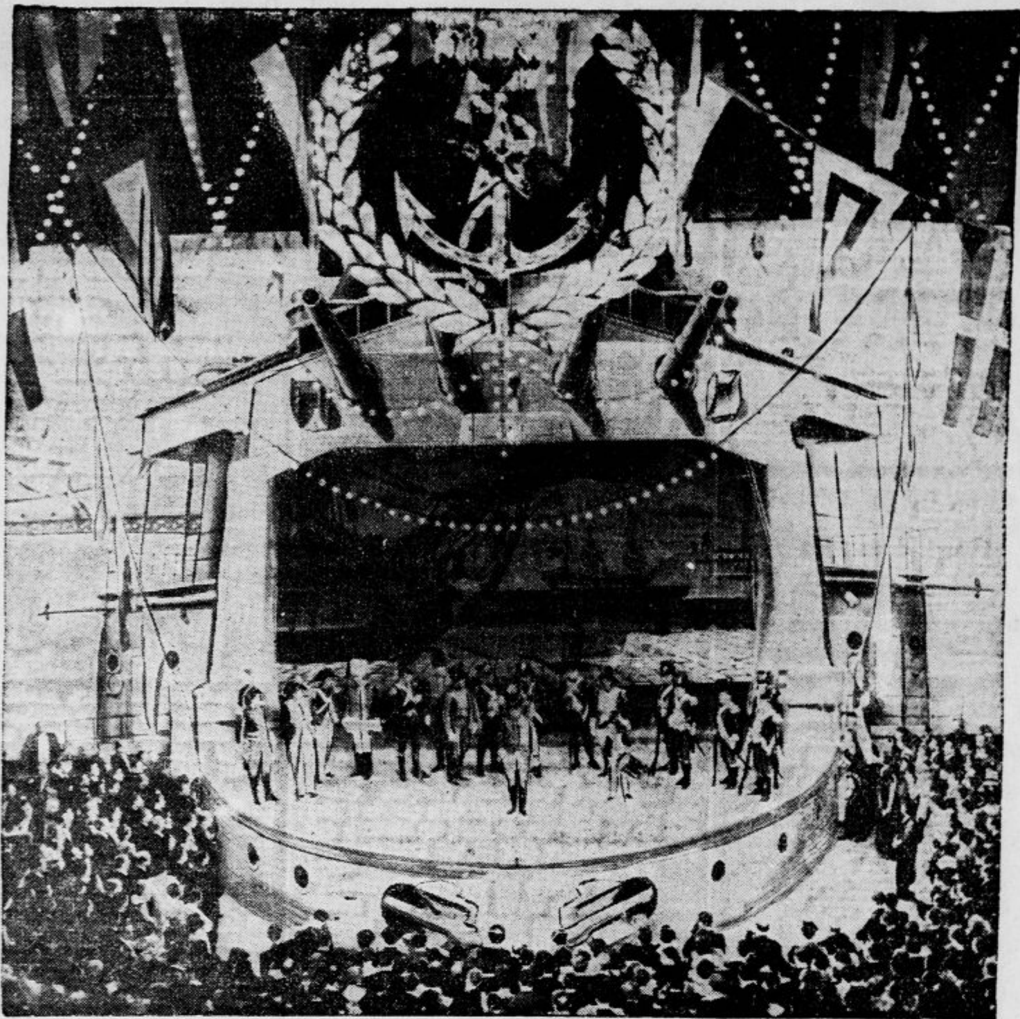
V pariški operi so imeli prošle dni velik mornariški ples, ki se ga je udeležil tudi predsednik republike. Dvorana je imela zunanost vojne ladje