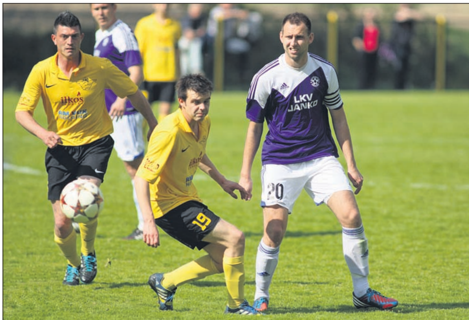
Nogometaši Gerečje vasi (v vijoličastih dresih) so v nedeljo v Stojncih zadali domačinom visok poraz.