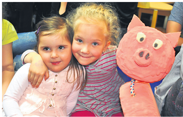
Uvertura v noč branja je bila lutkovna predstava Boter petelin.