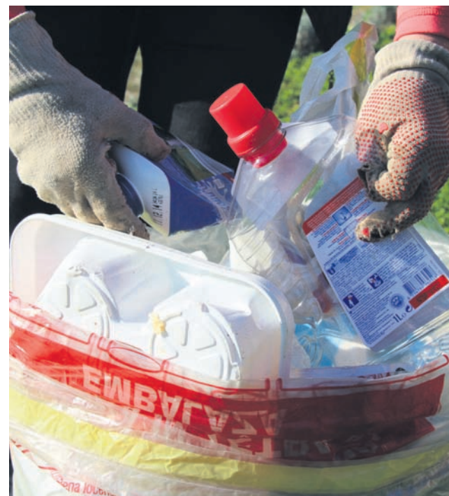
Tudi o tem, kako temeljito naj se odpadki pred odlaganjem na deponijo presortirajo, imata Sok in Trofenik različni stališči.

O poteku koncesijskih pogodb za obvezne občinske gospodarske javne službe