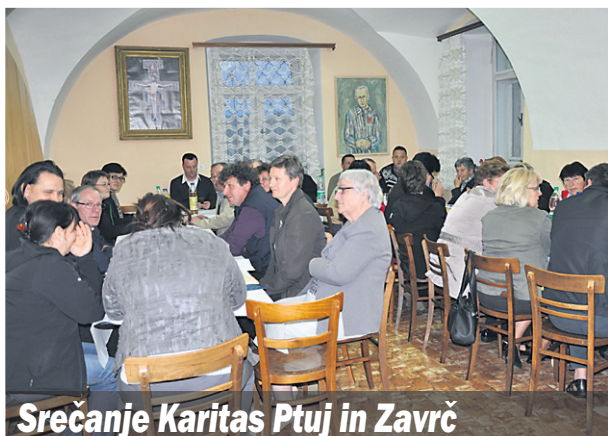
Srečanje Karitas Ptuj in Zavrč