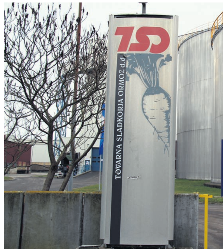
Največji trije lastniki družbe TSO v likvidaciji so nizozemska družba Cosu, janski lastniki ter Kmetijska zadruga Ptuj. Slednja ima v lasti 6,2-odsto

tem naslovu, kot je sedež TSO v likvidaciji in predhodno TSO. Po podatkih Ajpesa podjetje od ustanovitve do danes prihodkov iz prodaje ni ustvarjalo. Osnovni kapital podjetja znaša milijon evrov in pol. V enaki vrednosti so tudi obveznosti do virov sredstev. Torej: kolikor so vredni, toliko so dolžni.