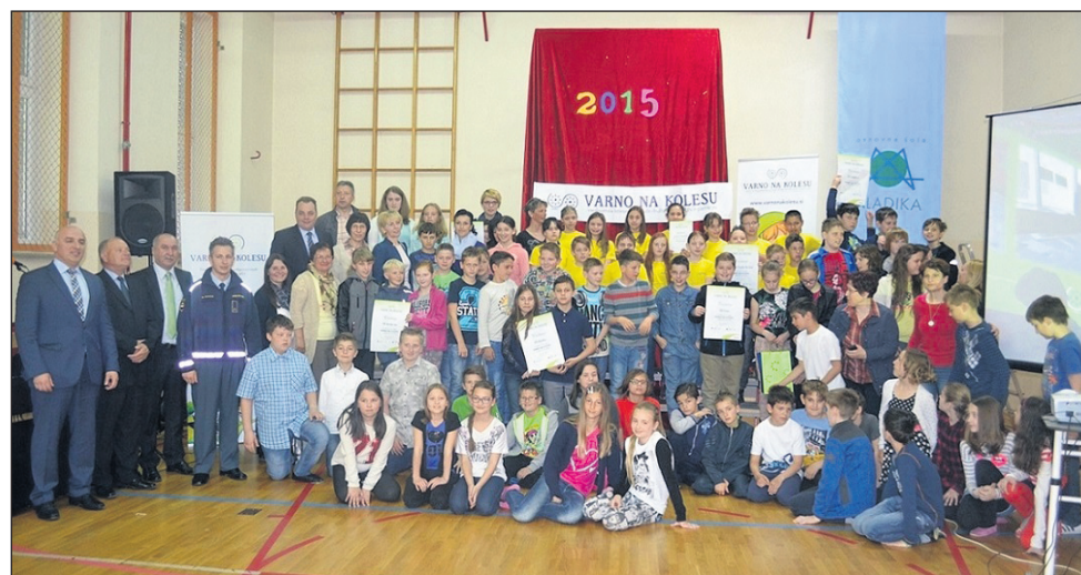
Tretje leto zapored je družba Butan plin s partnerji organizirala projekt Varno na kolesu.

V sredo bo delno jasno s spremenljivo oblačnostjo, ponekod bo dopoldne še pihal severni veter, na Primorskem pa šibka burja. V četrtek bo večinoma sončno. Zapihal bo jugozahodnik. Proti večeru se bo na zahodu pobleščilo in začelo rahlo deževati.