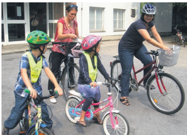
Vozniki naj posebno pozornost posvetijo pešcem, kolesarjem in motoristom, ki so v toplejših dneh spet na naših cestah.

»Tokrat je bilo težišče našega nadzora na tistih točkah, za katere smo sprejeli več pobud, kjer naj bi zaradi prekoračitve najvišje dovoljene hitrosti prihajalo do ogroža-