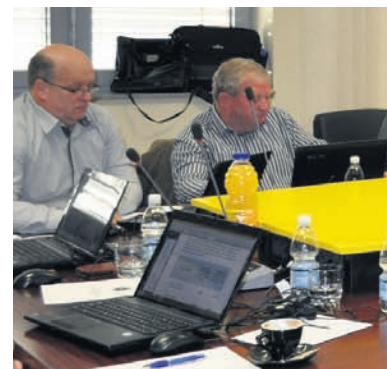
Majšperski občinski svet je podražitev

konec marca je bil strošek odvoza smeti za 240 litrov velik zabo- znik 19,05 evra, nato je postal strošek ravnanja s smetmi kljub prenehanju plačila dajatve za CERO Gajke še višji. Ali lastniki 240-litrskih posod odložimo 70 % več odpadkov?« je opozoril. Dodal je