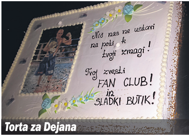
Torta za Dejana