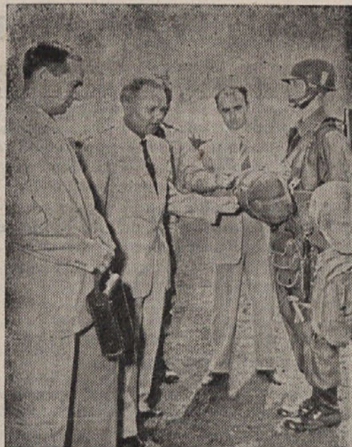
SADOVI KOEKSIŠTENČE: Miroljubni gospodje v civilnih oblekah so sovjetski častniki, ki na povabilo ameriške vlade proučujejo vojno opremo ameriških vojakov v Fort Benningu. (AND)

Kupčija s petrolejem je zelo dobičkosen posel, toda produkcijo in cene na svetovnem trgu kontrolira mednarodni koncern velikih petrolejskih družb, tako da praktično izven okvira tega koncerna ni