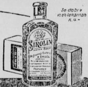
Se dobi v vseh lekarnah K. 14.