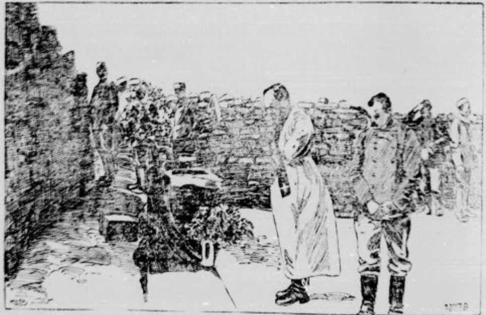
Francozi pokopavajo padle tovariše na Galipoliju.

Na Crnogorskem imajo čete generala Kóvenza ugodne uspehe severno od Berana in zahodno od Rožaja. Boji med Pečjo in Plavo so bili ljuti, prav tako tudi severno od Berana in zahodno od Rožaja. —