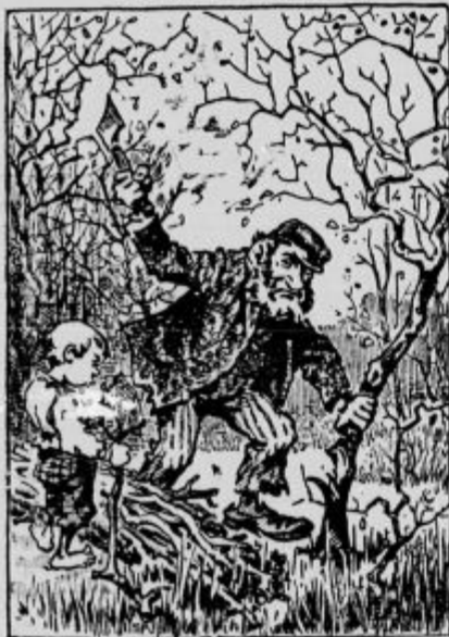
Kje je drugi drvar?