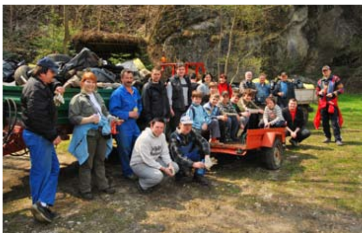
Skupinska slika udeležencev v Topolah.