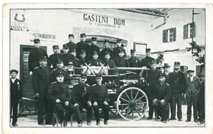
PGD Mengeš nekoč ...