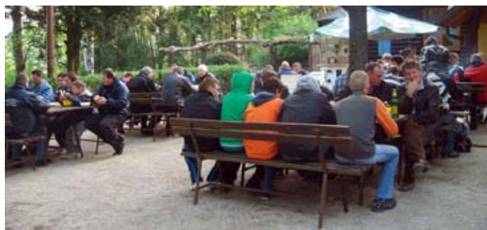
Golaž je vsem zelo teknil.