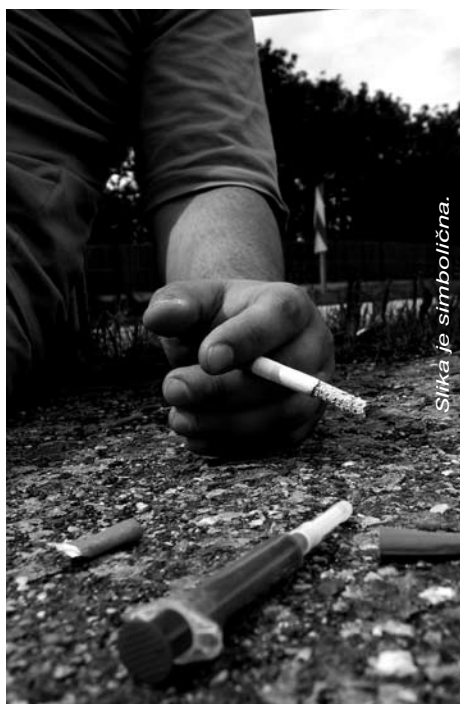
Slika je simbolična.

Na našem CSD se srečujemo z družinami, na katere smo največkrat opozorjeni s strani okolja ali zunanjih institucij, po pomoč pa se obrnejo tudi družine same. Največkrat se srečamo s posamezniki ali z družinami, ki imajo težave v družinskih ali partnerskih odnosih, veliko problematike je povezane tudi s težavami pri vzgoji in skrbi otrok, nasiljem v družini, mladoletnim prestopništvom ter težavami, povezanimi s slabšimi materialnimi in stanovanjskimi razmerami, težavami z različnimi oblikami zasvojenosti, težavami na