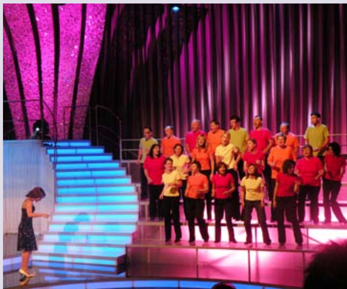
Nastop v oddaji Spet doma

Vabljeni vsi ljubitelji petja in dobre volje. Veseli bomo vašega obiska.