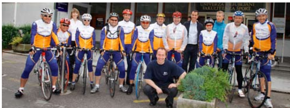
Lekovi kolesarji in ekipa Društva astma in šport