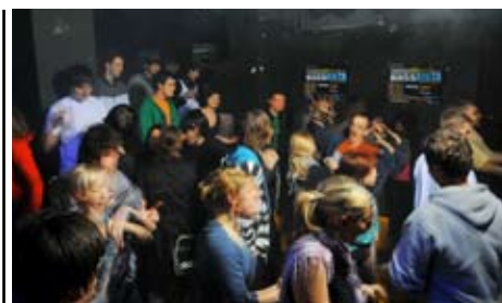
D'n'b Kišta je zažigala do konca.