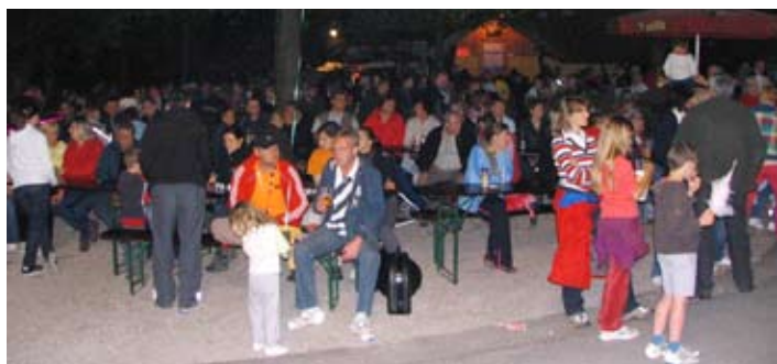
Na kresu se je zabavalo staro in mlado.