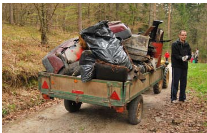
Prikolice so pokale po šivih.