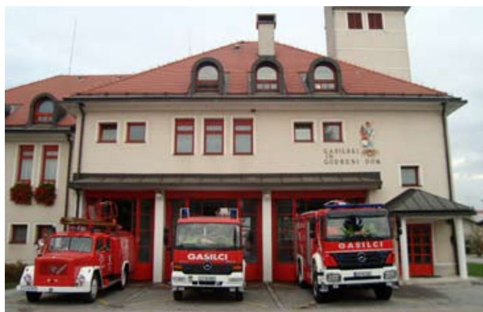
... in danes.