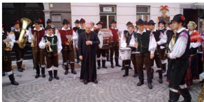
Godba Mengeš v družbi nadškofa Stresa