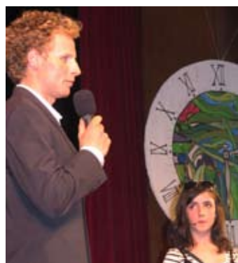
Olimpijec Klemen Bauer je prijazno pozdravil otroke.