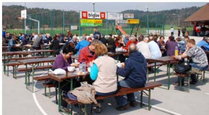
Ob koncu je sledilo prijetno druženje.