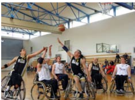
Zmagovalni pokal je osvojila ekipa DP Mercator Ljubljana (igralci v svetlih dresih).