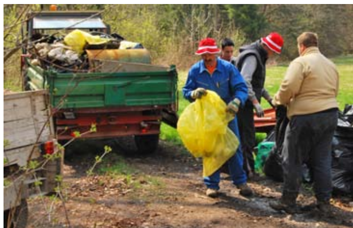
Zbirno mesto odpadkov v Kosezah.

Na koncu pa gre posebna zahvala vsem prostovoljcem, ki so priskrbeli kakršno koli mehanizacijo za potrebe prevažanja