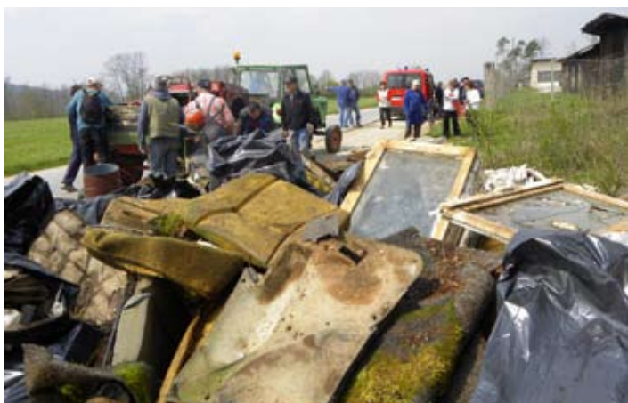
Zbrani odpadki na Drnovem.

in povzročala zmajevanja glav in neodobranja sodelujočih. Kar neverjetno je, kaj lahko storita kolektivni duh in prava energija. Odstranili nismo samo površinskih odpadkov, pač pa tudi vse tiste, ki jih je zob časa že prekril z listjem in travo. Počistili smo veliko, zagotovo pa je ostalo še kaj, česar nismo našli. Mogoče v prihodnji podobni akciji pride na vrsto tudi to. Izkazal se je tudi naš župan, ki je tudi sam zavihal rokave in pomagal na enem izmed divjih odlagališč, ter nas na koncu čiščenja nagradil z zares dobrim golažem in pijačo v Športnem parku Loka. Poskrbljeno je bilo tudi za glasbo in čutiti je bilo prav prijetno vzdušje in zadovoljstvo vseh udeleženi v akciji. V imenu Ekologov brez meja, Občine Mengeš in TD Mengeš se vsem prostovoljcem, dobrim ljudem in vodilnim akterjem, najlepše zahvaljujemo za vso angažiranost in pripravljenost. Res je lepo videti in vedeti, da je v Sloveniji vse več ljudi, ki se zavedajo pomembnosti varovanja okolja za nas in za prihodnje rodove. Verjamemo, da smo na pravi poti, čeprav šele na začetku in da se bo v naših glavah, in predvsem glavah tistih, ki brezbrizno odlagajo smeti v naravo, le nekaj premaknilo in tega ne bodo več počeli.