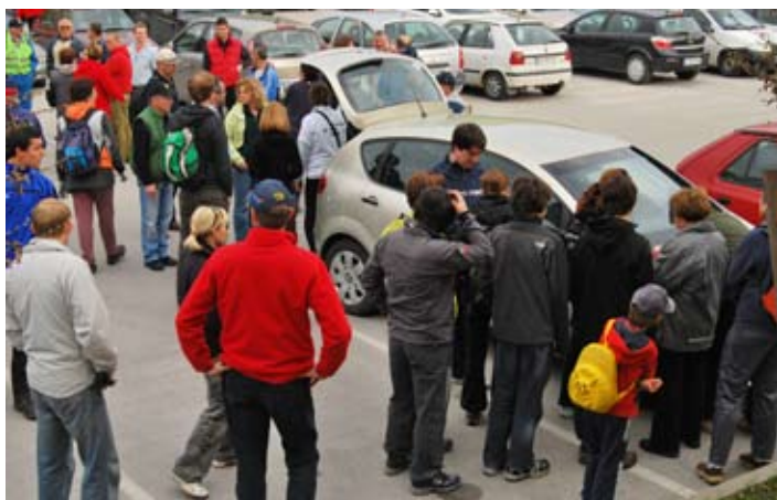
Jutranji zbor v Mengšu.