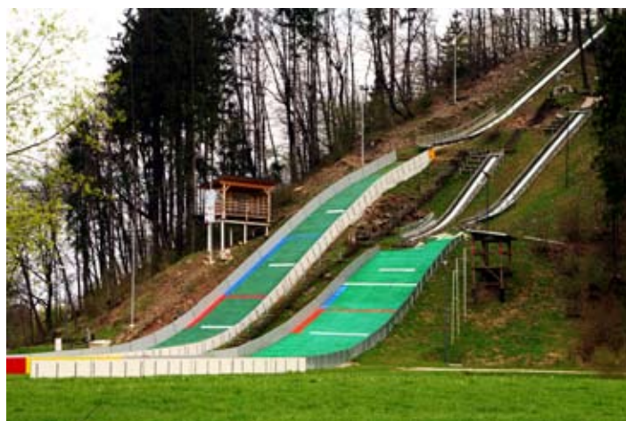
Skakalni center pod Gobavico očiščen in urejen čaka prve skakalce.

Tekmovalci, njihovi starši in ostali člani kluba so zares aktivni. Vsi skupaj so pred časom s skupščino potrdili opravljeno delo in dosežke minule sezone, pridružili so se vsakoletni čistilni akciji, udeležili so se že tradicionalnega blagoslova motoristov in skakalcev ... Starši so uredili in pripravili skakalni center pod Gobavico, tekmovalci pa že pilijo formo ter čakajo na prve skoke na skakalnicah s plastično podlago. Tako na suhih treningih nabirajo moč in kondicijo, pridobivajo pa tudi prepotrebne akrobatske spretnosti. Zato bodo, tako kot vsako sezono, zagotovo naredili za prve resne tekme doma ter na tujem. Tudi strokovni kader se primerno izobražuje, zato da bo vadba res učinkovita in varna. Naj pa ob tem povabim vse, ki bi se radi preskusili v tem zanimivem športu ter sebi in prijateljem dokazali, koliko poguma premorejo. Dobrodošli so tako fantje kot tudi pogumna dekleta vseh starosti. Tudi Rok Benkovič je začel s treningi šele pri enajstih letih, a kljub temu postal svetovni prvak. Vsak ponedeljek se lahko udeležijo popoldanskega treninga v telovadnici Osnovne šole Mengeš ali