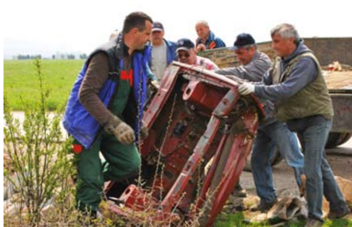
Tudi močne roke so bile potrebne.