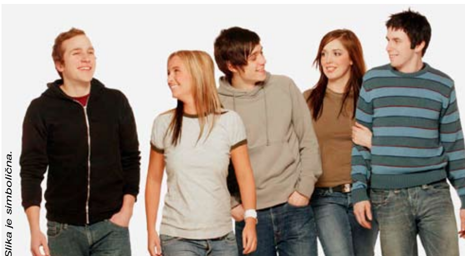
Slika je simbolična.

področju duševnega zdravja ipd. Opažamo, da je vedno več staršev, ki imajo težave z izvajanjem vloge starševstva, nemalokrat se izkaže, da obstaja v družini tudi sum na neustrezno izvajanje roditeljskih dolžnosti, vzgojna nemoč staršev in izpostavljenost otrok različnim oblikam nasilja.