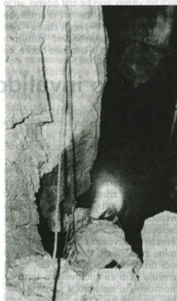
Začirska pečina - Črna gora. Plezanje brezna, vzpenjanje po statični vrvi

Poleg raziskav podzemeljskega sveta v domovini pa se udeležujemo tudi odprav izven naših meja. Februarja je bila organizirana odprava DZRJ Ljubljana. Na njej so sodelovali: 3 člani DZRJ Ribnica, en član JD Logatec pet članov DZRJ Ljubljana. Naprava je bila namenjena v Avstrijo v pogorje Tannengebüрге. Namen odprav je bil nadaljevati z raziskavami v jami Batmannhöehle. Jamo so odkrili in raziskali do globine - 1100 m francoski jamarji. V dogovoru z njimi so bili člani naše ekspedicije obvezani