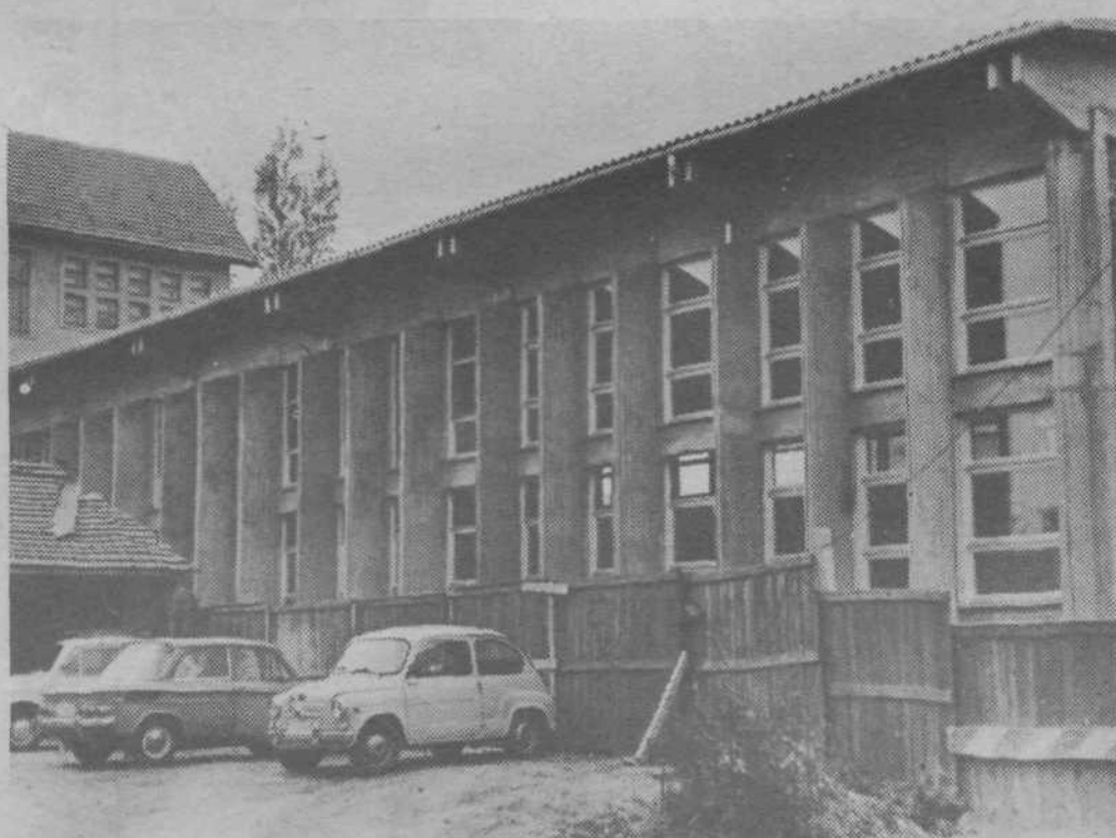
Nova moderna telovadnica pri šoli Vide Pregarc bo velika pridobitev za tamkajšnje šolarje. Tudi za ta objekt je šel denar iz piclega občinskega proračuna.

21. NOVEMBRA POHITIMO NA VOLIŠČA IN ODDAJMO GLASOVE ZA NAŠE OTROKE