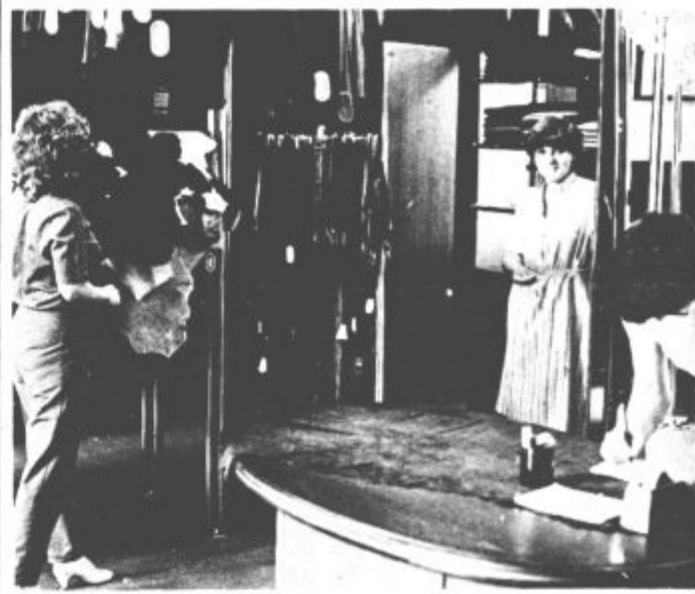
Prizadevajo si, da bi imeli na voljo izdelke, ki jih v drugih trgovinah ni