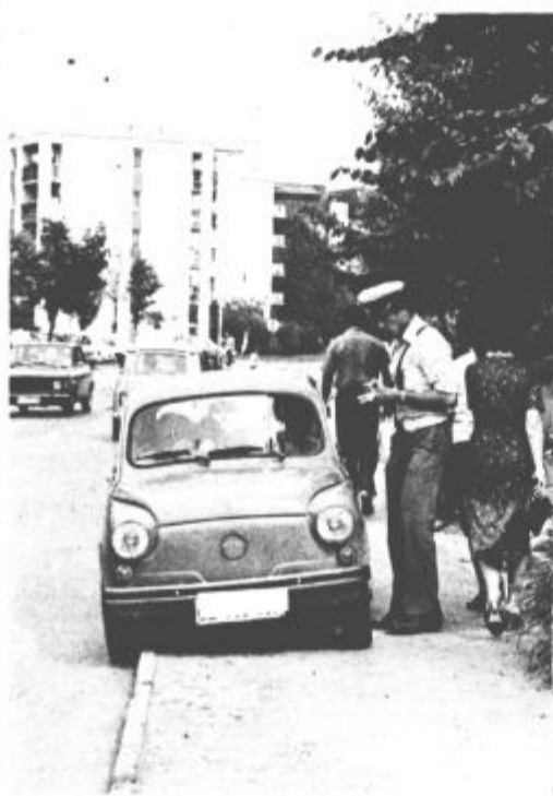
Že večkrat so miličniki opozarjali, da je parkiranje vozil na delu Prešernove ceste (nasproti samopostrežne trgovine) prepovedano. Opozorila in prometni znak pa očitno ne zaležeta dovolj. Še vedno je precej voznikov, ki morajo zaradi tega seči v žep. (B. M.)