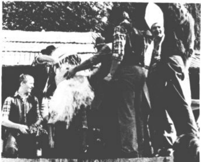
Ljubenski flosarji so letos pridobili v svoje vrste kar dva nova člana, ki se ob krstu zunanji (in notranji) mokroti pač nista mogla izogniti.