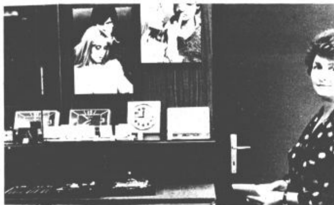
Ze na začetku se je pokazalo, da je tudi specializirana prodajalna zlatarn Celje v Titovem Velenju potrebna