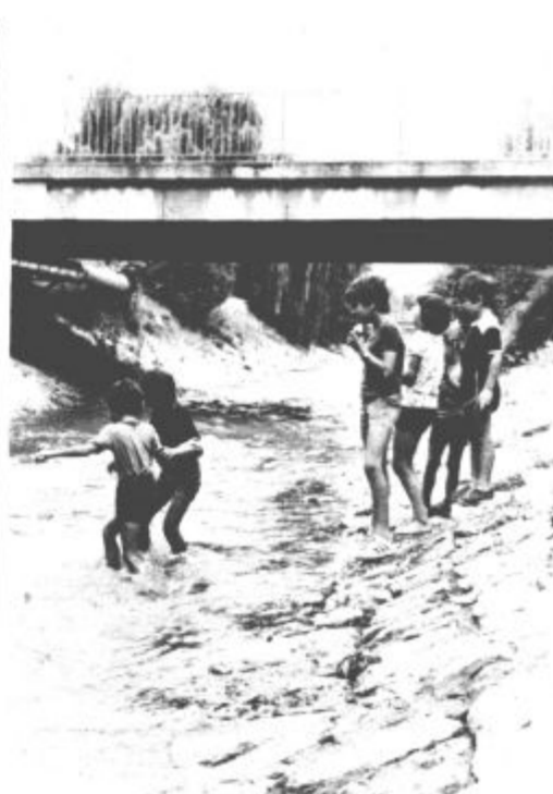
V teh vročih dneh je kakršna koli osvežitev nedvomno dobrodošla. Vsa si jo poišče po svoje. Nekateri so odšli na morje, drugi na bližnja kopališča. Mnogo je tudi takšnih, ki jim potoki in reke niso premrzle. Takšna ugotovitev velja tudi za mladež na gornjem posnetku, ki si je poiskala razvedrila v reki Paki. (B.M.)