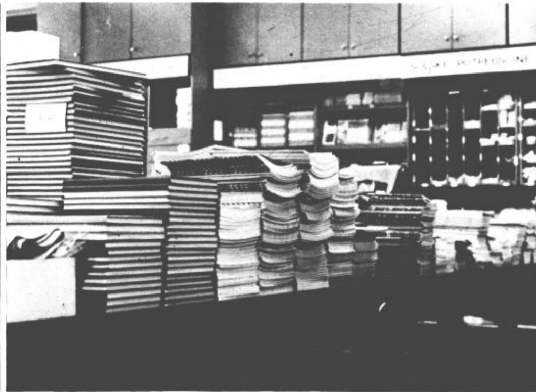
Le še slab mesec dni nas deli od pričetka novega šolskega leta. V poslovalnici Mladinske knjige v Titovem Velenju imajo že večino učbenikov in šolskih potrebščin. Tako je torej ostalo še dovolj časa za nakupe. V Mladinski knjigi priporočajo, da jih opravite čim prej, saj se boste tako izognili morebitni gneči, ob pričetku novega šolskega leta.

Prodajalno rib Tržnice v Titovem Velenju večina občanov sicer prav gotovo že pozna, vsi, ki vam ribe še niso redna prehrana, pa se le ustavite v njej in izberite kaj, svojemu okusu primernega. Navsezadnje so ribe (nekatero cene smo tudi zapisali) še vedno znatno cenejše v primerjavi z drugimi vrstami mesa, so pa enako kvalitetne. M. Zakošek