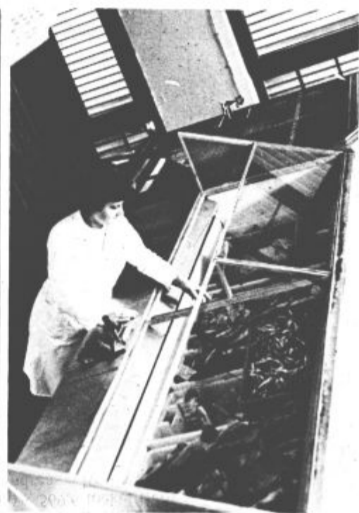
Tako kot drugje po naši domovini, tudi v velenjski prodajalni rib ugotavljajo, da smo dokaj slabi jedci rib. Pa vendar bi veljalo v času, ko v mesnicah pogosto ni mesa, poseči po tej vrsti hrane. Ker so tudi cene dokaj ugodne, izbira pa v prodajalni rib na velenjski tržnici zares velika, se le odločite kdaj tudi za takšen obed.