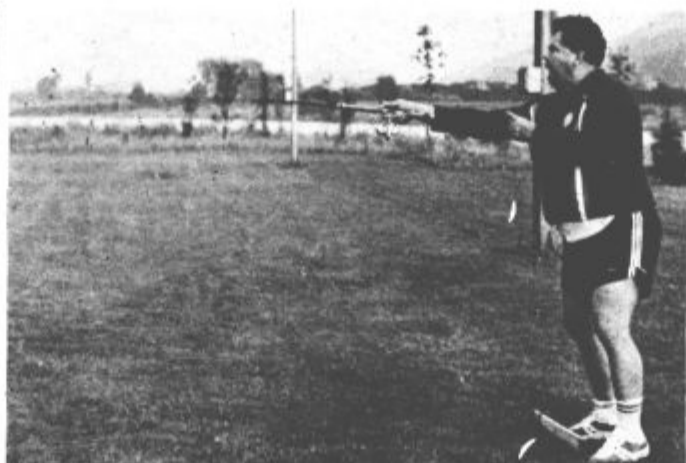
Treba se je bilo kar krepko potruditi, saj je bila konkurenca zelo močna