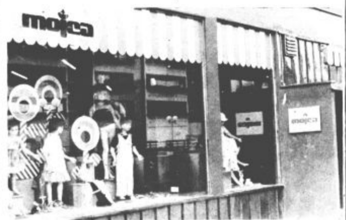
Tudi zunanji videz kaže na urejenost trgovine.

Na Trgu Edvarda Kardelja v Titovem Velenju so pred dvema mesecema odprli novo prodajalno otroške konfekcije za predšolske