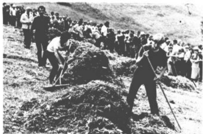
Grabljice so močno hitele