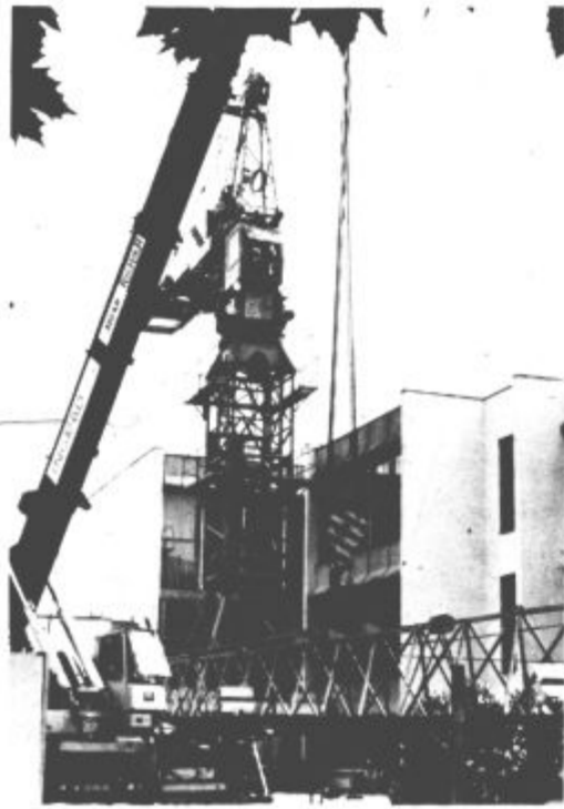
Zaradi velike prostorske stiske na osnovnih šolah v Titovem Velenju in zaradi premajhnih sredstev, da bi lahko pričeli z gradnjo nove šole, bodo v teh poletnih dneh na osnovni šoli Anton Aškerc z 18 milijonov din nadgradili sedanje poslopje za eno nadstropje ter tako pridobili nekaj dodatnih učilnic. Na ta način bodo vsaj delno omilili prostorske težave.