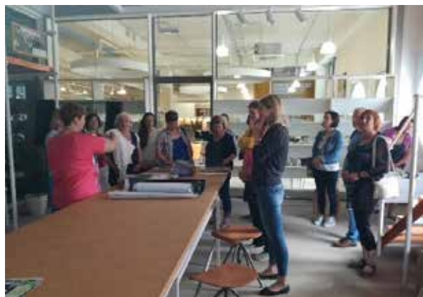
Ekskurzija: Ivan Cankar, Vrhnika

letja, mlade in odrasle bralce naše knjižnice. Bralci posamezne bralne skupine se ob knjigi srečamo enkrat mesečno. Vsebina prebrane knjige nam je iztočnica za pogovor, izmenjavo mnenj o prebranem, tudi s pomočjo osebnih izkušenj, prepričanj in obujanj spominov. Srečujemo se v čitalnici knjižnice ali v Detelovi sobi. Spomladi pa