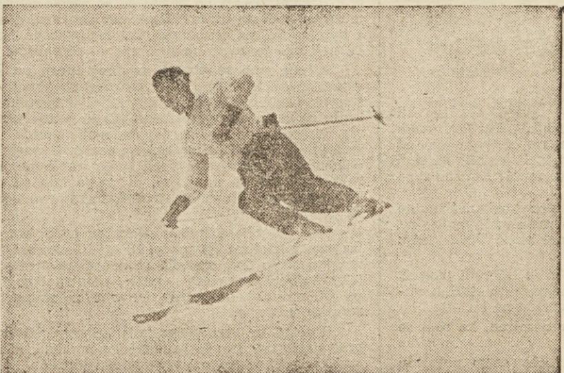
Slavni Senger se je moral danes zadovoljiti s 4. mestom

Pred 100.000 gledalci je v zadnji tekmi Arsenal premagal Burnley s 3:2 in s tem osvojil angleško prvenstvo.