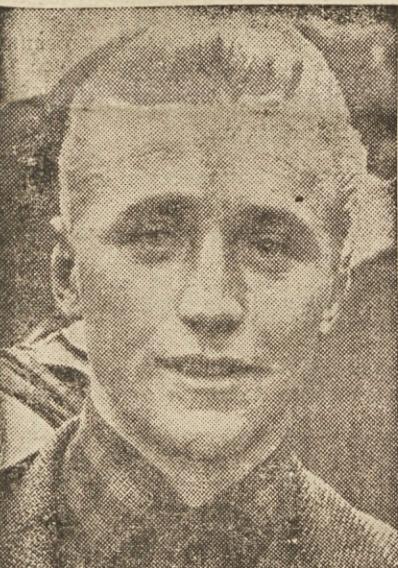
Mladi Avstrijec Molterer je danes ponovno dokazal, da je eden najbolj alpskih vozačev na svetu.

Beograd, 1. maja. Prvega in drugega maja je bil v Beogradu košarkarski turnir, na katerem so sodelovale poleg državne reprezentance tudi ekipe BSK, Vojvodine in Beograda. Ta turnir je bil organiziran predvsem zato, da tehnično vodstvo ugotovi, v kakšni formi se nahajajo igralci državne reprezentance. Doseženi rezultati so pravzaprav prava podoba stvarnih moči vseh nastopajočih moštev, predvsem pa smo lahko zadovoljni z igro našega izbranega moštva. Rezultati: BSK : Vojvodina 43:31 (23:10), drž. reprezentanca : Beograd 79:42 (31:24), BSK : Beograd 53:53 (34:25), drž. repr. : Vojvodina 88:58 (45:19), Beograd : Vojvodina 75:53 (29:22), drž. repr. : BSK 58:38 (25:15).