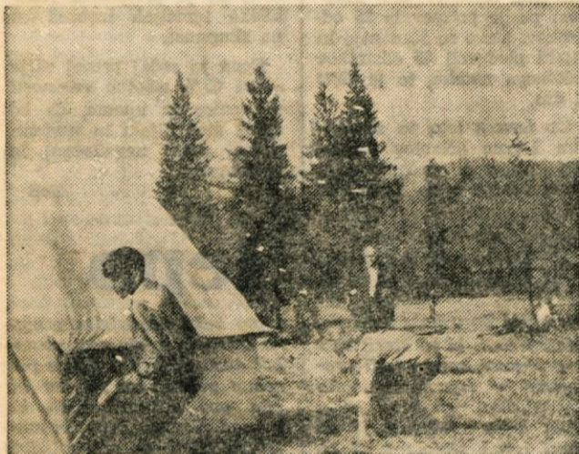
»Gorski levi« na tekmovalju za Čičev memorial